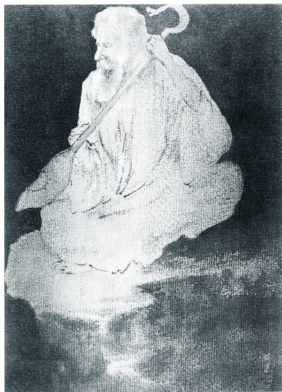
Fig. 1 Abanindranath Tagore, Rabindranath in the Role of the Blind Bard of his Dance-Drama, «Phalguni» , vers 1916. Aquarelle sur papier, 20 x 25 cm. Rabindra-Bharati Society, Calcutta.

Bengale. C'est essentiellement dans le choix des thèmes et dans la mise en œuvre de procédés techniques spécifiques que s'est manifestée avec le plus d'évidence la volonté de renouvellement de l'artiste.