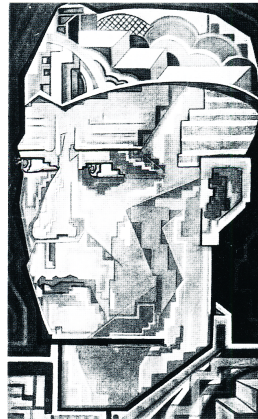
Fig. 8 Subho Tagore, Jawaharlal the Builder , vers 1950. Aquarelle et gouache, sur papier, 27 x 17 cm

Au début des années cinquante, l'artiste réalisa une série de trois portraits – Rabindranath the Poet , Subhas the Fighter et Jawaharlal the Builder – qui lui valut un certain succès. Ces trois peintures célébraient les trois grandes personnalités de la modernité indienne: le poète (son oncle Rabindranath), le soldat (Subhas Chandra Bose) et le constructeur de la nation (Jawaharlal Nehru). Elles furent réalisées suivant le même principe de composition: un jeu de lignes droites orthogonales fractionnant la figuration. Ce principe de divisionnisme possède une triple origine. La stylisation évoque la production des tisserands, chez qui le divisionnisme des formes est induit par la mécanisation du métier à tisser 61 . L'œuvre fait également référence au fractionnement initié par le cubisme. Dans Jawaharlal the Builder (fig. 8), le partage de l'espace pictural associé à un traitement quasi monochrome rappelle la facture chère au cubisme analytique. Mais, de manière indéniable, Subho Tagore s'inspire ici des œuvres de Gaganendranath