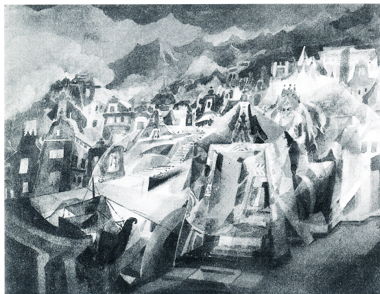
Fig. 5 Gaganendranath Tagore. Dwaraka on the Eve of its Doom , de la série Wonderland , vers 1920. Encre et lavis sur papier, 29 x 24 cm. Rabindra-Bharati Society, Calcutta.

Cette appellation de « cubiste » accolée par la critique indienne à ce nouveau style proposé par Gaganendranath paraît peu fondée, pour ne pas dire erronée. Dans les encres sur papier de Gaganendranath Tagore intitulées The House Mysterious: Composition II (fig. 4) et Composition III (de la série Wonderland ) exécutées au début des années 1920, ce