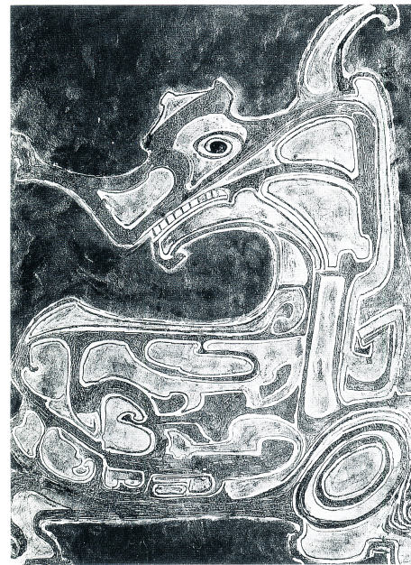
Fig. 7 Rabindranath Tagore, Sans titre, non daté. Encre et pastel sur papier, 28 x 38 cm. Rabindra-Bharati Society, Calcutta.