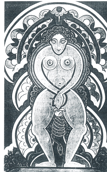
Fig. 9 Subho Tagore, Ewiges Weib (Eve) , vers 1950. Tempera sur bois, 180 x 70 cm.

datant des années vingt. Nous retrouvons ce même principe de fractionnement de l'espace pictural dans d'autres œuvres de Subho Tagore, comme dans Mechanization (représentant un ouvrier construisant des pylônes) et Power Generation , deux peintures à tempera sur bois réalisées au début des années cinquante, où l'artiste nous présente sa fascination pour la machine en associant des éléments de figuration humaine avec la représentation de vis, d'écrous, de ressorts et de plaques de métal 62 .