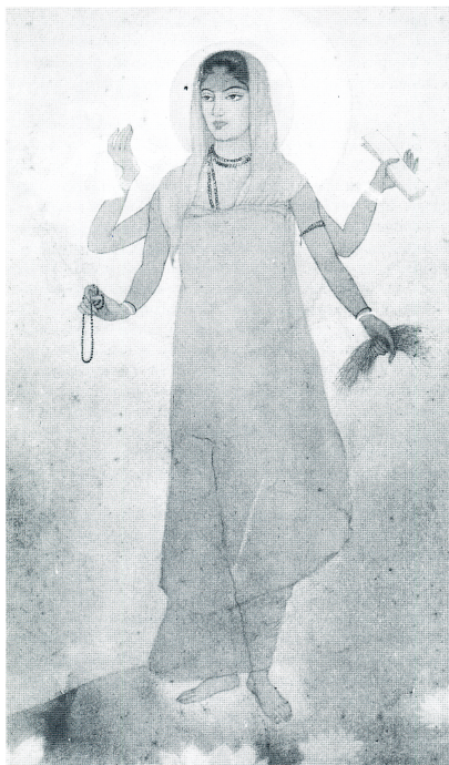
Fig. 2 Abanindranath Tagore, Bharat Mata , 1905. Gouache et aquarelle sur papier, 22 x 46 cm. Rabindra-Bharati Society, Calcutta.

Au sein des œuvres d'Abanindranath Tagore et de celles de ses disciples, l'Indianité devait s'exprimer tant dans la forme que dans le contenu. Nous pouvons distinguer trois grands thèmes fréquemment traités dans les productions de l'École du Bengale: l'historique, le poétique, le religieux.