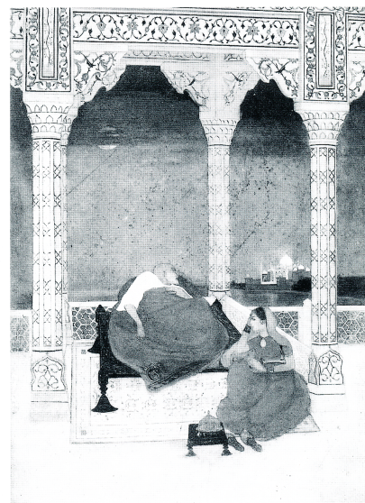
Fig. 3 Abanindranath Tagore, The Passing of Shah Jahan , non daté. Huile sur bois, 35,5 x 25,5 cm. Rabindra-Bharati Society, Calcutta.

Les faits et les personnages de l'histoire indienne ont été abondamment interprétés dans l'œuvre d'Abanindranath. L'éventail de ces sujets va de l'évocation de l'empire d'Asoka, comme dans Tissarakshita , Queen of Asoka (1910), à celle de l'empire moghol, avec The Trilogy of the Taj , série comprenant Shah Jahan Dreaming of the Taj (1902-1903), The Building of the Taj (1901) et The Passing of Shah Jahan (1902). Le dernier volet de cette trilogie (fig. 3) représente les derniers moments de l'empereur Shah Jahan, emprisonné par ordre de son fils Aurangzeb dans le Fort rouge d'Agra et contemplant le Taj Mahal depuis son lit de mort. Cette œuvre connut un succès immédiat. Elle reçut la médaille d'argent au Delhi Durbar en 1902 et devait recevoir la médaille d'or au Congress Industrial Exhibition de 1903. The Passing of Shah Jahan devint l'œuvre emblématique de la nouvelle esthétique de l'École du Bengale; à ce titre, le tableau fut reproduit et diffusé à de nombreuses reprises dans les magazines de l'époque.