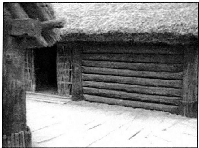
Fig. 1. Fuste reconstituée sur le site archéologique de Biskupin (Pologne)