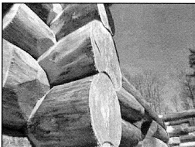
Fig. 2. Aiguebelle : fuste de mélèze en construction, entailles en tête de bœuf

- Verticalement, la stabilité est obtenue en plaçant l'axe de symétrie de chaque billot suivant l'axe de chaque mur. Cette opération que nous appelons « la mise en position du bois » est très délicate en raison des courbures fréquentes et plus ou moins prononcées de chaque bille ou billot.