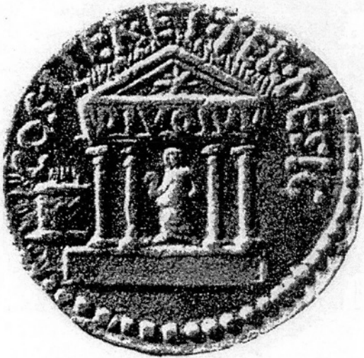
Fig. 1. Monnaie d'Octave avec la représentation du temple du divin Jules (F. Coarelli, Il Foro romano , 2, Fig. 44)

fut dédié par Octave que le 18 août 29 av. J.-C., après la célébration du triomphe lié à la victoire d'Actium 13 . Pendant toute cette période, un culte s'organisa sans doute autour d'un autel restauré ou refait par les triumvirs en 42. Une monnaie frappée par Octave en 36 (Fig. 1) montre le temple de César divinisé, alors en construction. Sur le revers de la monnaie, un autel est représenté à la gauche du temple consacré au divin Jules ; c'est l'autel érigé en 42 14 . La monnaie triumvirale montre une statue de César à l'intérieur du temple du divus Julius ; bien visible de l'extérieur, elle évoque ses fonctions religieuses en le représentant avec le lituus , le bâton de l'augure.