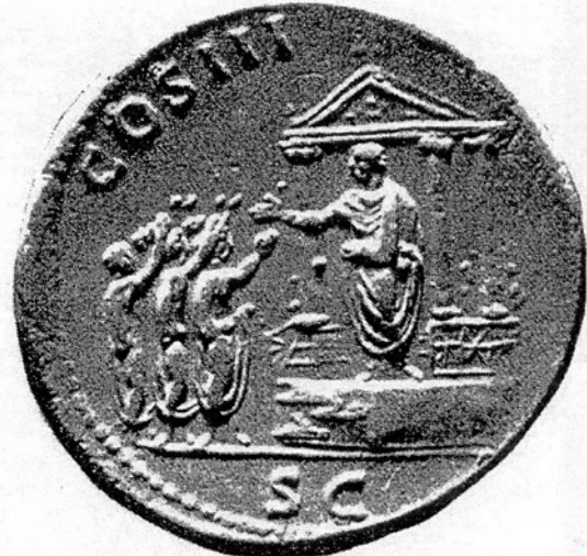
Fig. 2. Monnaie d'Hadrien représentant les Rostres du temple du divin Jules (F. Coarelli, Il Foro romano , 2, Fig. 87)