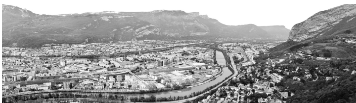
Figure 2. Vue sur la Presqu'île depuis le massif de la Chartreuse.