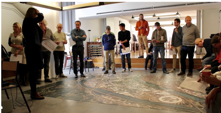
Figure 3. Séminaire multiacteur pour identifier les premiers éléments du transect, novembre 2017.

Pour la Presqu'île de Grenoble, nous avons construit le tracé du transect à partir d'un séminaire multiacteur organisé autour d'une photo aérienne géante du site. Étaient alors invités à débattre trente chercheurs dont certains ont leur laboratoire dans ce quartier même. Issus des disciplines du génie électrique, des sciences et technologies de l'information, des sciences humaines et sociales, de l'économie et de l'environnement, ils sont membres du programme Eco-Sesa et spécialisés dans les domaines des usages de la société en rapport à l'énergie, les systèmes des réseaux en ville et du développement de matériaux et composants 5 . Chacun pouvait repérer et décrire les nœuds et les interfaces en jeu pour les questions énergétiques. De là, un choix de tracé a été arrêté afin de saisir, dans un même rabattement en coupe, les situations singulières de par leur fonctionnement, leur besoin où leur rôle autant que des situations que l'on pourrait dire paradigmatiques, à savoir qu'on peut les retrouver à d'autres endroits sur la Presqu'île, et dont un exemple est suffisant pour la représentation.