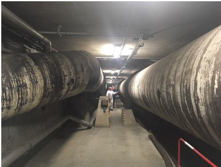
Figures 5 et 6. Traversée d'ouest en est de la Presqu'île scientifique, itinéraire guidé par un technicien du LNCMI : vue depuis la station de pompage au niveau du Drac et en longeant les réseaux d'eau passant sous la voie rapide, septembre 2017.

Le transect a ensuite été mis en débat sous la forme d'une « table longue 8 » lors de plusieurs séminaires de chercheurs, d'acteurs du territoire et d'usagers des lieux. Les acteurs étant mélangés entre eux, un des intérêts du dispositif a été dans leur rencontre, l'écoute et le partage de leur récit réciproque. Le dispositif de la table longue consiste à disposer dans un espace public une table de grande longueur - ici le transect faisait un peu plus de 8 mètres de long -, sur laquelle on déploie la représentation d'un transect territorial et autour de