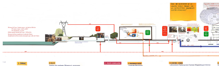
Figure 8 : Zoom sur le transect au niveau du Drac, Biomax, LNCMI et GreeEr, janvier 2019.

Grâce à la mise en partage par le transect du devenir de l'eau, nous avons pu relever différents nœuds socioénergétiques en lien avec des interfaces environnementales, mobilisant l'élément aquatique. Il s'agit de situations singulières comme le système de pompage et d'évacuation de l'eau pour rafraîchir les systèmes techniques du LNCMI 9 , ou de