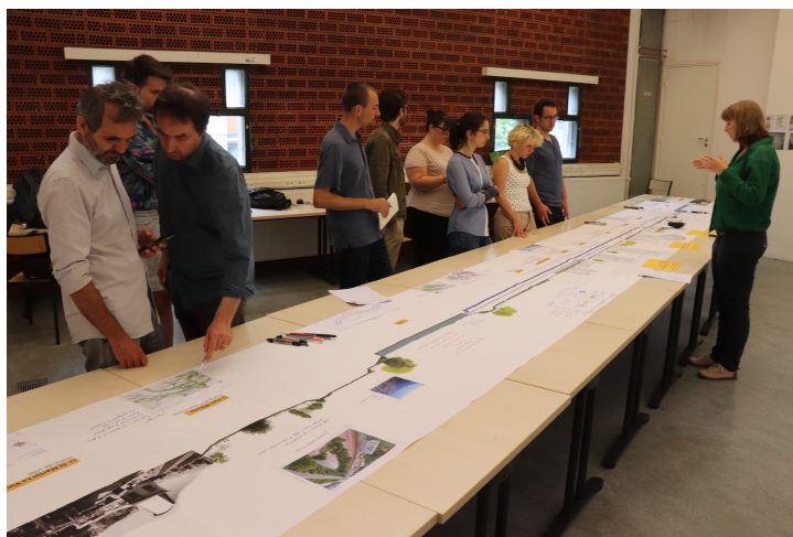
Figure 7. Mise en débat du transect lors d'une table longue, juin 2018.

laquelle on invite un collectif d'acteurs divers à « se positionner » - spatialement, oralement et graphiquement. Paroles d'habitants, paroles d'experts, paroles d'acteurs et de gestionnaires, photographies, expressions des usages, données quantitatives, zooms sur un point particulier, éléments de diagnostics et d'enjeux, esquisses de projets... se posent sur la table - invitant les personnes qui tournent autour à réagir à ce qui est déjà inscrit, à ajouter d'autres commentaires, informations ou récits, et surtout à mettre en débat leurs propres opinions, à les confronter aux représentations des autres et à prendre acte des modalités d'émergence et d'énonciation d'un enjeu partagé sur les lieux investigués. En cela le transect fonctionne comme un objet intermédiaire (Vinck, 2009), intermédiaire entre les acteurs, entre les disciplines, mais aussi intermédiaire entre une situation présente et les façons, d'une part, de faire évoluer les modes de gestion et, d'autre part, de penser le devenir des éléments qui composent le site.