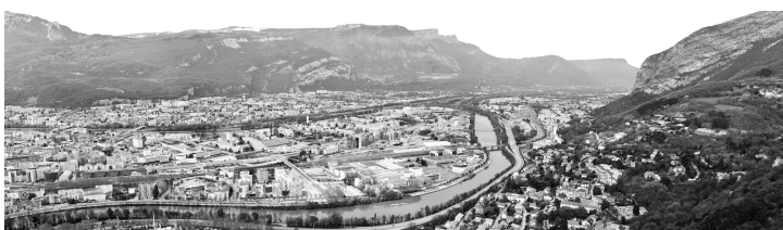
Figure 2. Vue sur la Presqu'île depuis le massif de la Chartreuse.