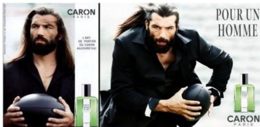
Image 1. Publicités Caron