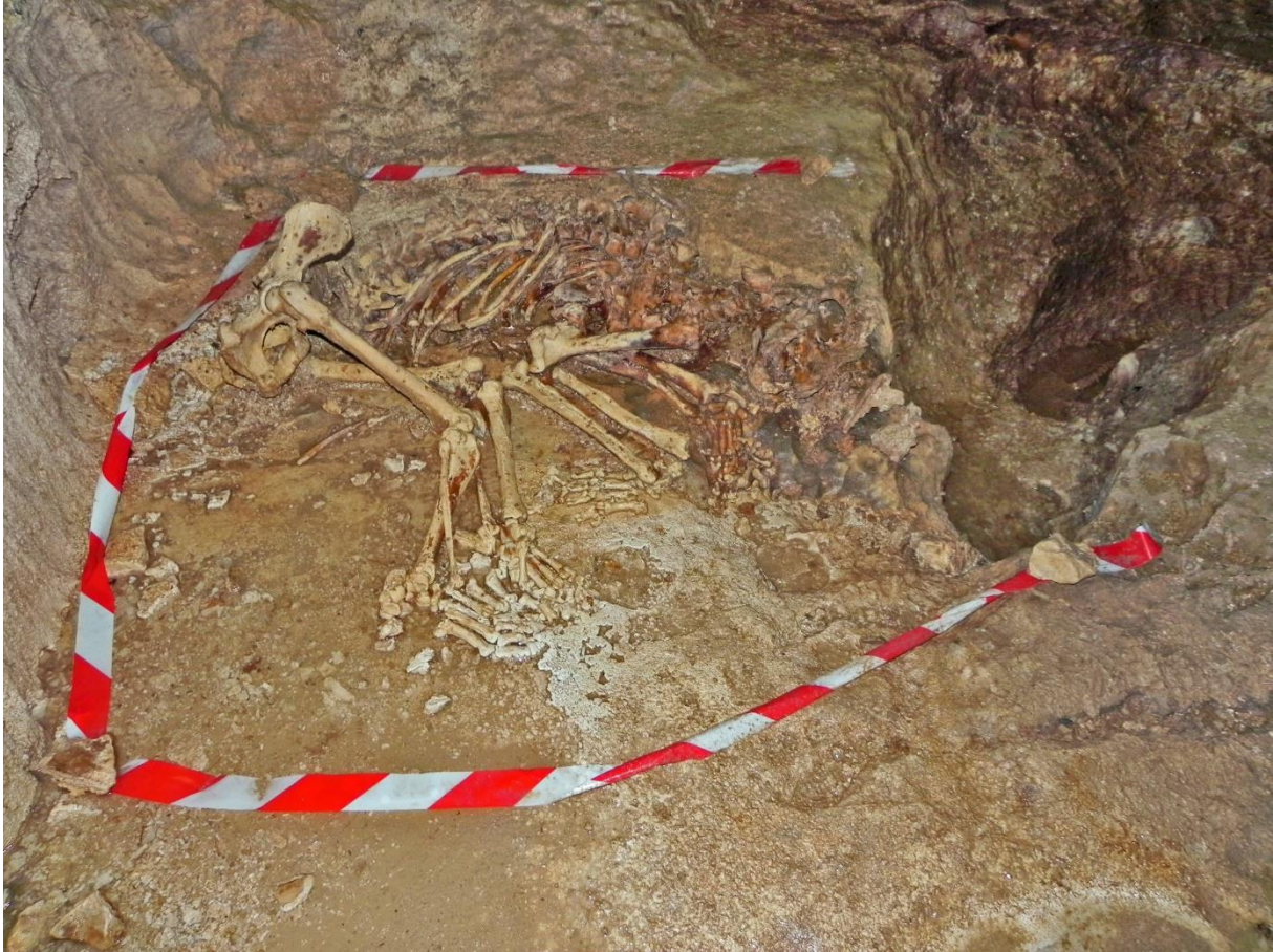
Fig. 3 : Position du squelette de l'ours brun « Jean Mouloud ».

Le squelette de cet ours brun gisait au fond d'un puits de 30 m de profondeur. Il reposait sur une surface sensiblement horizontale. Sa tête se trouvait quasiment au centre de ce puits, juste sur le bord supérieur d'une marche haute d'environ 70 cm. Cet ours, dont les os sont restés en connexion anatomique quasi parfaite, était couché sur le côté gauche. Les pattes antérieures complètement repliées contre le poitrail et les pattes postérieures en position semi fléchie, étaient ramenées vers l'avant (Fig. 3). C'est la position dans laquelle devait se trouver l'animal au moment de sa mort et rien n'a bougé depuis :