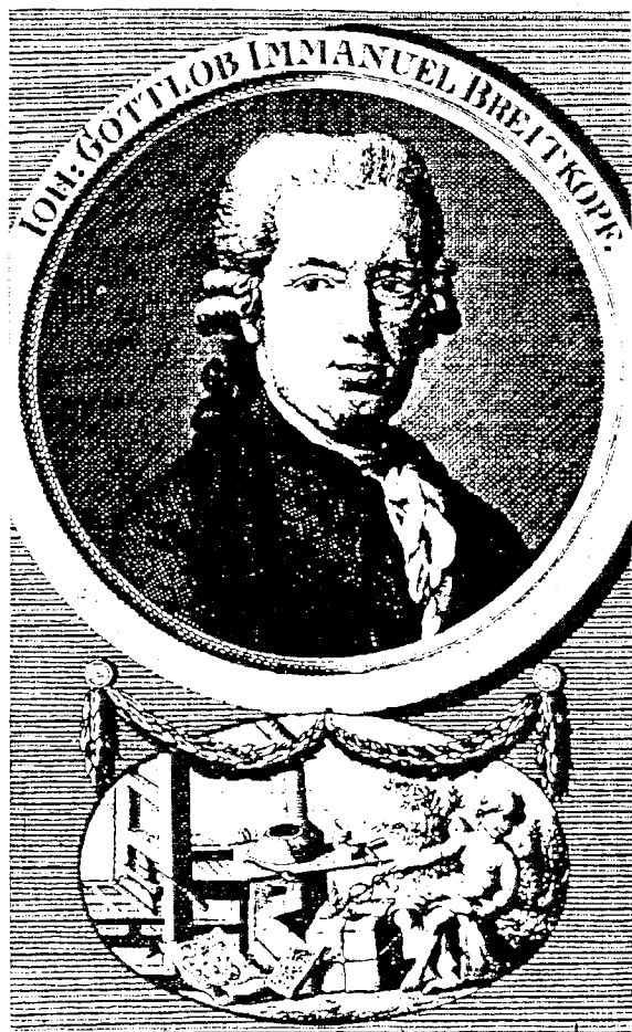
Gottlob Immanuel Breitkopf

standards of their time. Especially Unger's font seems to lay more in the 19 th century spirit.