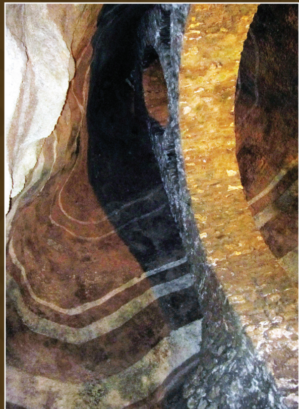
Figure 6. Grand fontis vidé, stabilisé et renforcé dans la galerie de l'ancienne sortie des Catacombes. Les lignes peintes sur le ciment projeté indiquent les différentes strates traversées.

Actuellement, 500 000 visiteurs par an visitent les Catacombes de Paris (14 e arrondissement, gérés depuis 2012 par l'établissement public Paris Musées). Ce succès se fait au détriment de la conservation du lieu qui souffre, depuis le début des années 1980, de la « maladie verte » (prolifération d'algues). Les Catacombes présentent aussi des aménagements critiquables : câbles électriques masqués dans de volumineuses goulotte en plastique fichées sur des architectures du siècle des Lumières, éclairage blanc permanent favorisant la photosynthèse et donc la prolifération des algues, mousses et même rares petites herbes, information indigente, parcours amputé quasiment de moitié ne permettant plus l'observation de deux fontis sécurisés d'une manière astucieusement pédagogique, pourtant les seuls intérêts géomorphologiques du site (figure 6) (Thomas, 2017b).