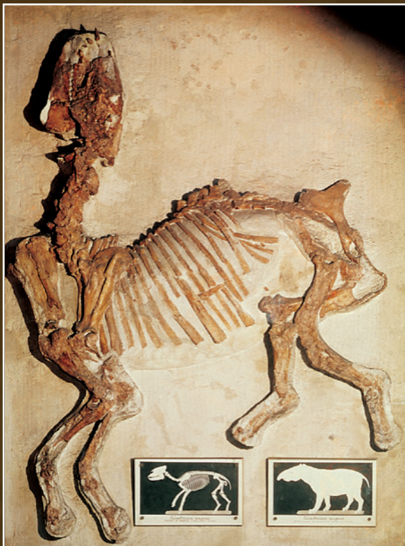
Figure 3. Représentation du squelette du Palaeotherium magnum découvert par le géologue Gaston Vasseur en 1873 dans une carrière de gypse à Vitry-sur-Seine. Aujourd'hui, ce fossile est exposé dans les galeries d'Anatomie comparée du muséum d'Histoire naturelle de Paris (dessin de M. Delahaye, paru dans le « Magasin pittoresque » de 1874).

scientifique et artistique ». (3) En 1979, la société d'Études historiques des anciennes carrières souterraines sélectionna les anciennes carrières des Capucins pour y créer un éco-musée de la Pierre et des carrières ; le travail de ses membres bénévoles aboutit au classement par arrêté du 8 juin 1990 de la fontaine des Capucins, puis le 25 octobre 1999, la protection fut élargie à un secteur beaucoup plus vaste. (4) Les carrières sous le Val-de-Grâce furent classées au titre des Monuments historiques le 1 er mars 1990 par association avec le bâti de surface : « l'ancienne abbaye du Val-de-Grâce : sol et sous-sol ». (5) Enfin, par décret du 4 janvier 1994, « une partie de la carrière souterraine du chemin du Port-Mahon et du sol des parcelles correspondantes » a été classée au titre des Monuments historiques. Quatre carrières parisiennes souterraines sont désormais intégrées à l'Inventaire national du patrimoine géologique (INPG lancé officiellement par le ministère de l'environnement en 2007), celles des Catacombes (ensemble des faciès sédimentaires du Lutétien de Paris), des Capucins (calcaires bioclastiques à miliolites et à « cérites » typiques du Lutétien supérieur de Paris), du musée à Vin (faciès des Lambourdes du Lutétien moyen de Paris), (8) du Val de Grâce et de la maison de la Géologie (calcaires à miliolites et à « cérites » du Lutétien supérieur de Paris) et du chemin de Port-Mahon (calcaires à miliolites et à « cérites » du Lutétien moyen et supérieur de Paris).