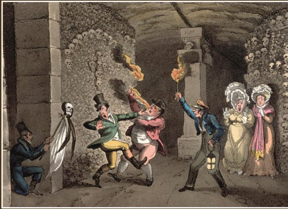
Figure 5. Cette scène illustre une petite farce « catacombesque ». Elle se déroule après que les visiteurs, parfaitement identifiés, eurent refusé de suivre leur guide pour visiter les cabinets de minéralogie (nommé par l'auteur geologic cave : « caverne géologique ») et de pathologie. L'illustration montre le fait que les visiteurs ont, de tout temps, été plus attirés par l'Ossuaire que par l'intérêt géologique des Catacombes (dessin : Cruickshank ; Carey, 1822).

D'où la mesure de protection, prise en urgence en 1986, pour éviter la disparition prématurée du site pour cause de pression immobilière. D'autres sites souterrains se sont révélés fossilifères. Après le prélèvement d'un fossile d'Acanthomorpe (début Tertiaire – Actuel : poisson généralement à épines creuses non segmentées en avant des nageoires dorsale et anale) en ciel de carrière sous le bois de Vincennes au milieu du XX e siècle, trois spécimens similaires furent découverts dans deux carrières de Méry-sur-Oise (Val-d'Oise) en 2008. Les carrières d'Herblay et de Conflans-Sainte-Honorine présentent aussi un intérêt paléontologique : une mâchoire et des ossements y ont été découverts en 1992 et authentifiés comme étant des restes de Lophiodon (Éocène : mammifère proche de nos actuels tapirs).