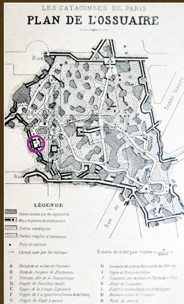
Figure 4. Plan au 1/2 000 de l'ossuaire des Catacombes de Paris datant de 1892 (Gérards, 1892). Cercle de mauve, le cabinet de minéralogie des Catacombes aujourd'hui détruit.