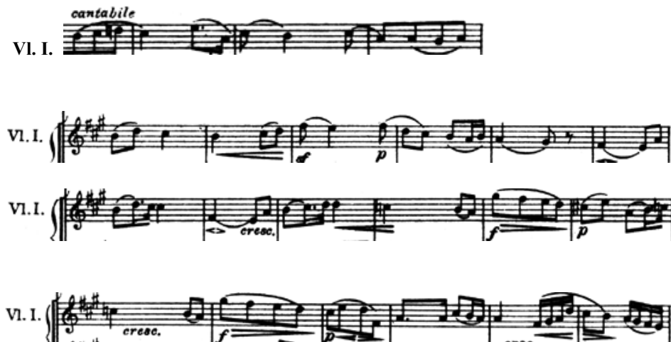
Exemple 4 : Thème A de l'Adagio [avec anacrouse]

Quant au thème du sixième mouvement, il prend lui aussi son essor dans les « traces » du cantique. Ses points d'appui sont ceux-là même du thème générateur dans son élan ascendant: 4 te , 6 xe mais majorisée comme signe d'accomplissement, et 8 ve . En outre, Mendelssohn en fait l'écho d'une intonation qui hante toute son œuvre, celle le Magnificat du 3 e ton, mais qu'il semble encore une fois déduire intégralement de son idée initiale.