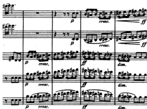
Exemple 7 : Tempête [mutation du développement terminal]

Au sens de l'économie unitaire de la forme, on a ainsi la démonstration que la reproduction de ces pans de forme sonate, en augmentant la présence thématique et motivique du thème générateur, peut déboucher sur les renouvellements d'expression les plus inattendus.