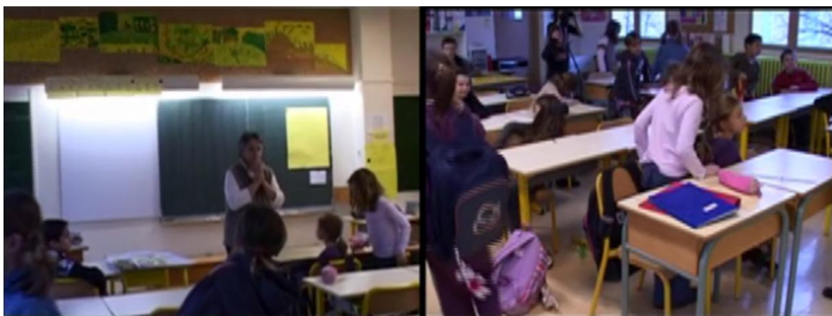
Fig. 1 Classe de primaire

En effet, ces discours oraux et écrits, cette part langagière du travail qui est le cœur de l'action de l'enseignant de langue, s'ils sont essentiels à la compréhension des situations et à la préparation des programmes de FOS, ne se donnent pas à lire aisément. Ils ne révèlent pas tout, comme l'illustre l'exemple suivant. Il s'agit des premières minutes d'une journée de classe de CE2. La maîtresse fait entrer les élèves dans la classe, et commence à échanger avec eux :