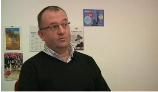
Fig. 4 Interview sur le cours Les grands auteurs en gestion (discours sollicité)

Cette seconde stratégie « données existantes + données sollicitées » a été reprise sous une forme différente par l'ouvrage Le français des infirmiers (Goy-Talavera, Gardette-Tira & Perez, 2017 : 94). Les informations contextuelles sollicitées auprès des gens du terrain pour élucider l'arrière-plan culturel n'ont pas abouti à des interviews, mais à des écrits d'accompagnement, servant d'introductions aux séquences, par exemple celui-ci dans la séquence Accueillir un patient :