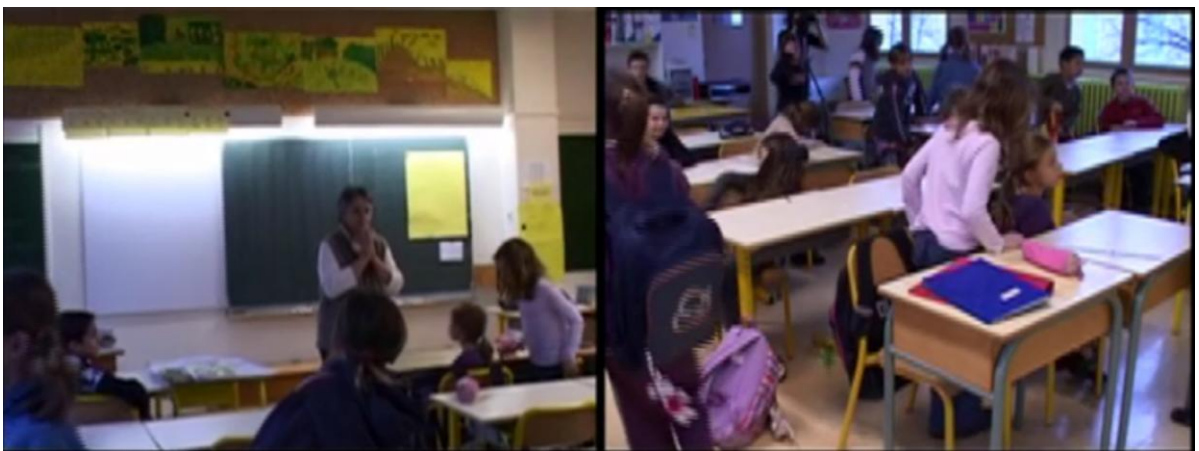
Fig. 1 Classe de primaire

En effet, ces discours oraux et écrits, cette part langagière du travail qui est le cœur de l'action de l'enseignant de langue, s'ils sont essentiels à la compréhension des situations et à la préparation des programmes de FOS, ne se donnent pas à lire aisément. Ils ne révèlent pas tout, comme l'illustre l'exemple suivant. Il s'agit des premières minutes d'une journée de classe de CE2. La maîtresse fait entrer les élèves dans la classe, et commence à échanger avec eux :