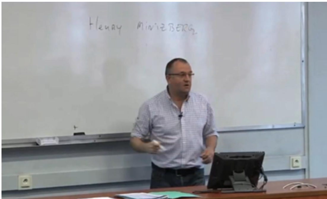
Fig. 3 Cours magistral d'économie-gestion 1ere année : Les grands auteurs en gestion (discours existant)

C'est ainsi que, dans un programme destiné aux étudiants en mobilité, on retrouve combinés un extrait de cours magistral intitulé Grands auteurs en gestion avec une interview de l'enseignant expliquant l'objectif général du cours, son contenu et les modalités d'examen (Parpette et Stauber, 2014). Les données sollicitées permettent de restituer le contexte d'une donnée authentique - un extrait de cours magistral d'une dizaine de minutes - qui ainsi isolé a perdu une large part de son contexte : à quel enseignement appartient-il ? en quelle année ? quelles compétences vise-t-il à développer chez les étudiants ? etc. Les données sollicitées permettent également de restituer un contexte plus large : interviews d'enseignants décrivant l'ensemble d'un cursus de licence (Mangiante et Raviez, 2015), témoignages d'étudiants expliquant les méthodes de travail dans leur discipline, etc. Ces différentes données constituent autant de supports de formation linguistique – sous forme de documents authentiques - pour les apprenants dans les programmes de FOS, comme on peut le voir dans les ouvrages évoqués.