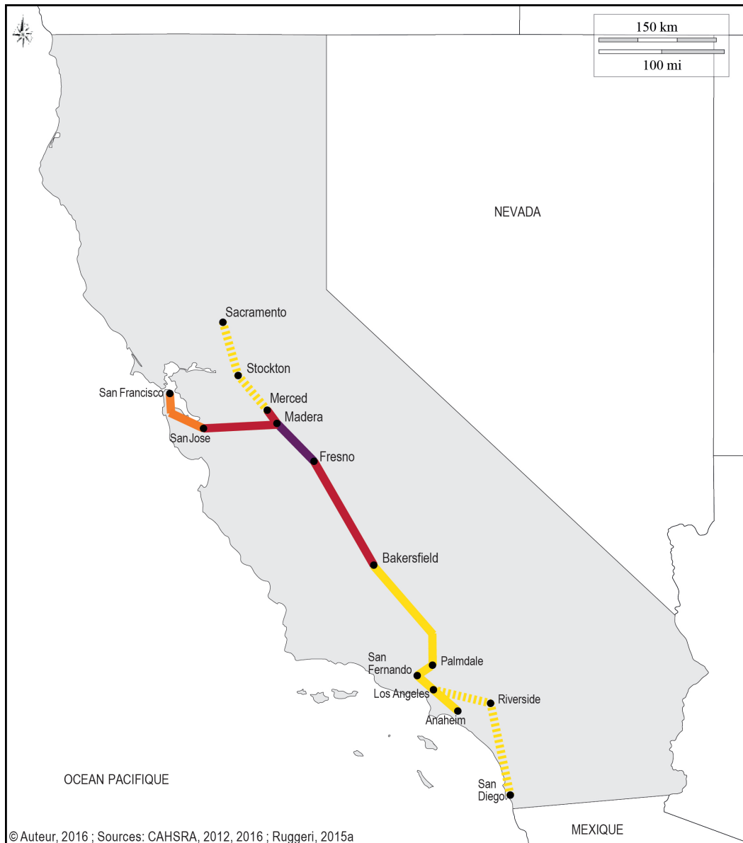
Figure 2. La ligne à grande vitesse californienne

© Auteur, 2016 ; Sources: CAHSRA, 2012, 2016 ; Ruggeri, 2015a