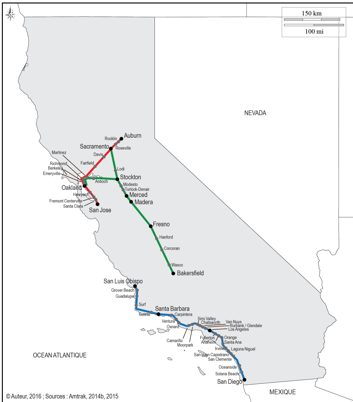
Figure 1. Le réseau ferroviaire d'Amtrak en Californie