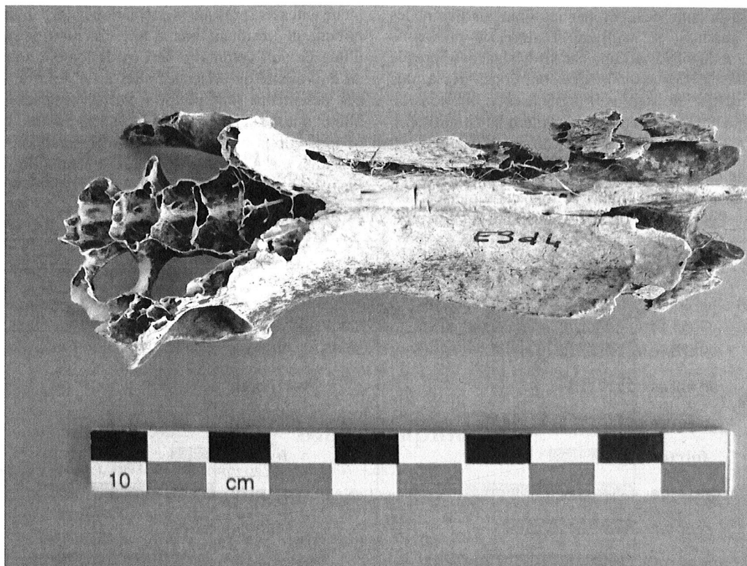
Figure 2: Offing 2. Bassin d'albatros à sourcils noirs ( Talassarche melanophris ) présentant des incisions longitudinales témoignant du prélèvement de la peau.

Nous avons interprété ces traces comme l'indication du prélèvement de la peau. Les peaux étaient sans doute incisées sur la face dorsale de l'oiseau, depuis le haut du crâne jusqu'à la queue, puis probablement détachées comme on retire un vêtement boutonné dans le dos. La régularité de ces modifications témoigne de gestes répétés, maîtrisés, en quelque sorte de la mise en œuvre d'une véritable "recette" de dépouillage.