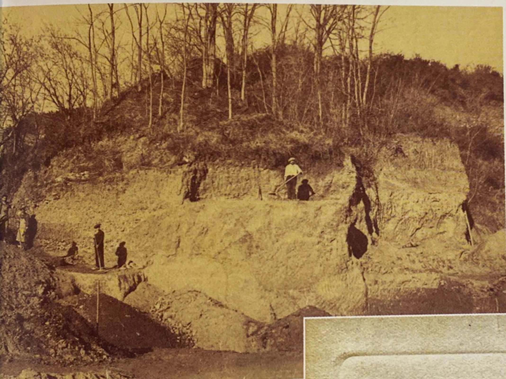
Sur des sites archéologiques ou dans les carrières, les ouvriers travaillaient dans des conditions parfois similaires. Fouilles à Saint-Gaudens au-dessus de Valentine (Haute-Garonne) d'un gisement du «Dryopithèque», vers 1856 ?