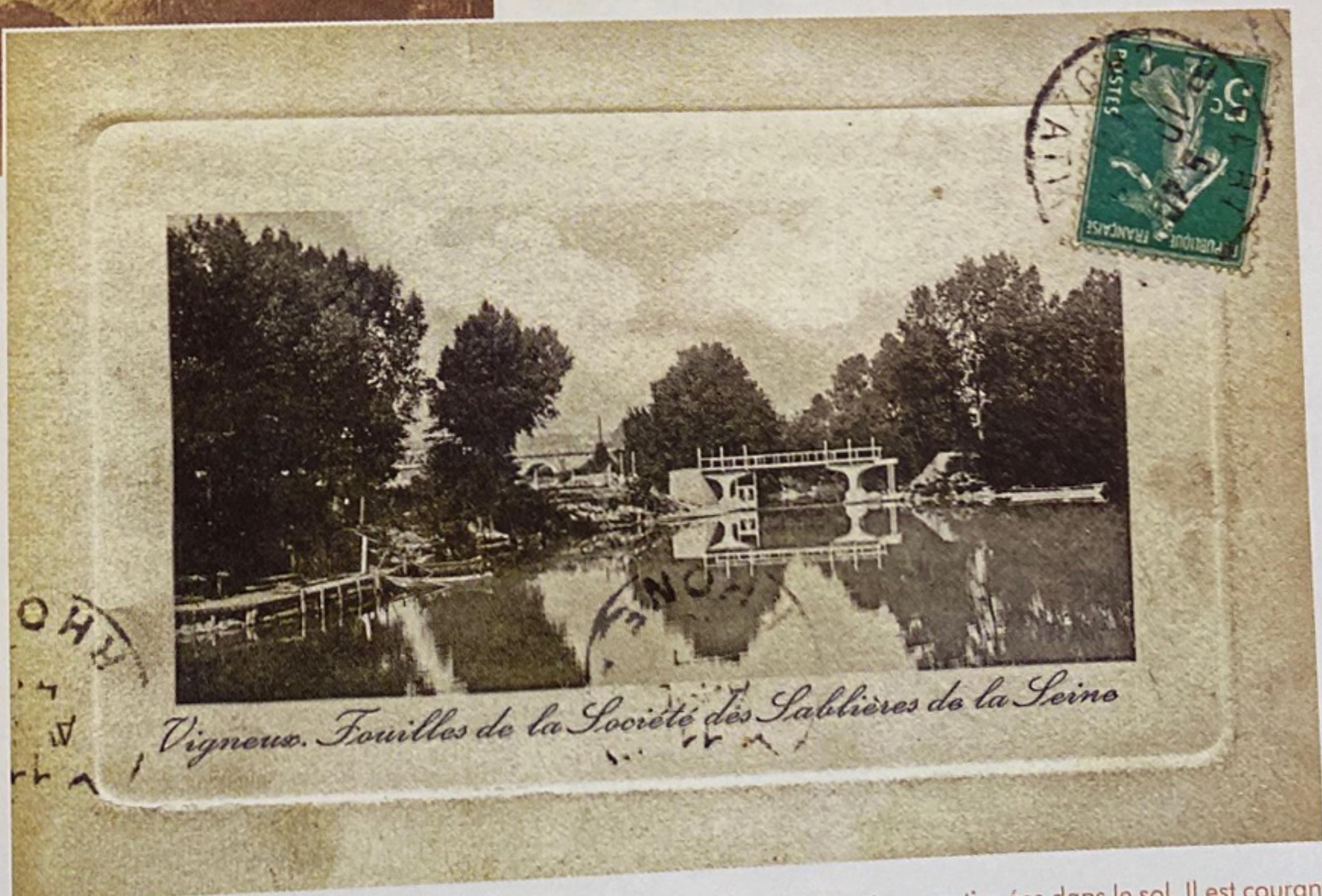
Historiquement, le terme de « fouilles » désigne très largement les excavations pratiquées dans le sol. Il est courant dans le vocabulaire des carriers. Vigneux. Fouilles de la Société des Sablières de la Seine (Société fondée en 1906). Début XX e siècle, entre 1907 et 1921.