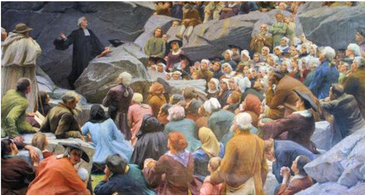
➤ Le Prêche au Désert ou La liberté de conscience, de Max Leenhardt (datée d'octobre 1896 – janvier 1898) h/t : 4,42 x 2,42 m, conservée au Musée du Désert, Mialet (30) Exposée au SAF de 1898 (n° 1236)