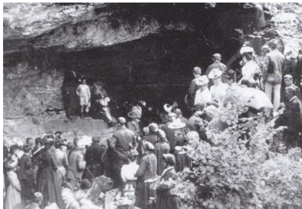
➤ Assemblée protestante à la Baume Dolente le 25 août 1901. Photographie noir et blanc 26 .

Claude Viala présente dans son ouvrage Grottes et caches camisardes , la reproduction d'un cliché photographique du rassemblement commémoratif de 1901 25 . Cette assemblée mémorable fut l'une des plus importantes en pays cévenol en ce début du 20 e siècle, avec la présence de mille cinq cent fidèles et vingt-et-un pasteurs. Sur ce cliché noir et blanc se retrouvent la densité des blocs de schiste, et la conformité du terrain en hémicycle, malgré une prise de vue légèrement différente.