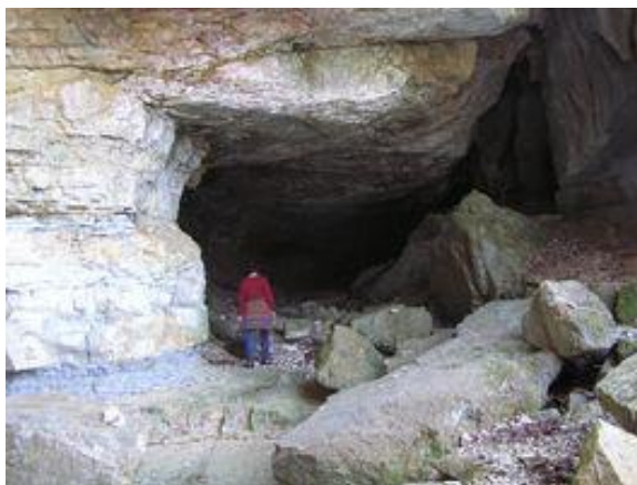
➤ Entrée de la Baume Dolente.

L'inventaire détaillé des grottes de la région, réalisé par des groupes de spéléologues peut à lui seul permettre d'étayer l'affirmation de Claude Viala. Cette grotte est la seule a posséder cette configuration, de permettre l'accueil d'un rassemblement d'une centaine de personnes devant son entrée principale. Les clichés récents de Marc Lemonnier montrent l'amas de blocs.