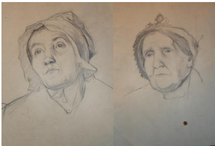
➤ Croquis de femmes en coiffe pour Prêche au Désert, de Max Leenhardt (datée d'août 1896) h/c : 0,31 x 0,23 m, Coll. Part. (France). Inv. DSC 06548 et DSC 06550/10 NH

C'est une vingtaine de dessins conservés dans des collections privées qui témoignent de la vie dans ce village. Avec une extrême habileté et une ressemblance poussée, Leenhardt a fixé sur le papier les tenues vestimentaires des villageois, les coiffes des dames, et les expressions quotidiennes.