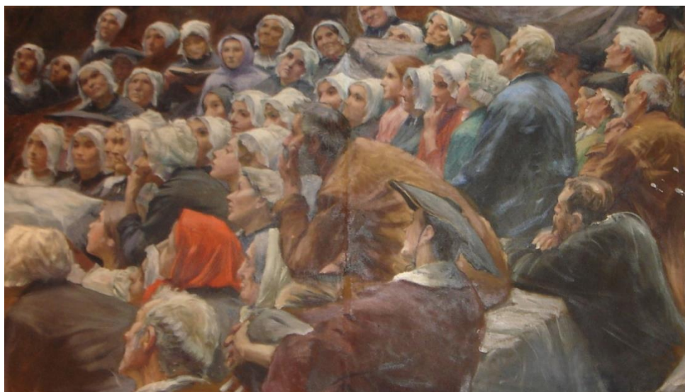
➤ Etude de groupe pour le Prêche au Désert, de Max Leenhardt (datée d'août 1896) h/c : 0,92 x 1,60 m, Coll. Part. (France). Inv. DSC 06539/10 NH

Dans un style abouti et largement influencé par les recherches sur la lumière de Gustave Courbet, il conçoit les deux grandes lignes de composition qui aboutissent au pasteur, dont la gestuelle en croix rappelle le crucifix dans l'Enterrement à Ornans (1850) . Une mort sans nom habite toute l'œuvre, par le foisonnement de portraits qui suivent les plis du relief jusqu'à s'y diluer :