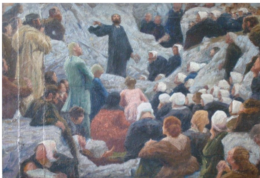
➤ Etude préparatoire du Prêche au Désert, de Max Leenhardt (datée de 1896) h/c : 0,58 x 0,40 m, Coll. Part. (France). Inv. DSC 04339/4 PF

Après ces rapides séjours estivaux dans le Cévennes avec son épouse, la décision est prise de retourner en famille dans le petit village cévenol de Vialas (Lozère, 48). Ce village est choisi pour son histoire et son atmosphère propre à restituer une époque, une identité cévenole : celle d'un village