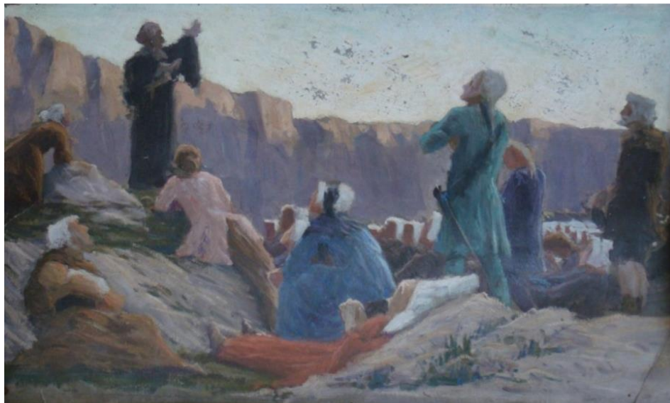
➤ Etude préparatoire du Prêche au Désert, de Max Leenhardt (datée de 1896) h/c : 0,46 x 0,29 m, Coll. Part. (France). Inv. DSC 04258/4 PF

Son courrier n'a pu permettre de reconstituer un itinéraire, mais il sillonna toute la région : Saint-Etienne Vallée Française, Saint Etienne de Valborgne, Le Can de l'Hospitalet, Florac et tant d'autres. Ces premières tentatives de composition sont incertaines. Les études sont posées dans un décor minéral imaginaire. De ce fait, il est facile de suivre la démarche du peintre en quête de vérité.