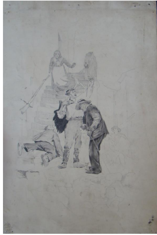
➤ Etude de composition inachevée Encre sur papier : 47 x 62 cm Non signé Clapiers, collection privée Inv. DSC 04434 – Série 6

Face à une multiplication excessive des peintres qui affluent sur Paris, les dimensions des toiles atteignent des dimensions frisant le gigantisme. Leenhardt prend la décision de peindre des personnages grandeur nature 13 , mais ce rend vite compte de la difficulté de l'exercice qu'il expose à son ami et cousin Eugène Burnand :