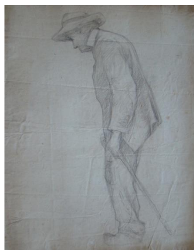
➤ Etude de vieillard Crayon sur papier : 62 x 47 cm Non signé Clapiers, collection privée Inv. DSC 04463 – Série 6