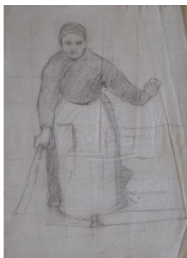
➤ Etude de femme dans escalier Crayon sur papier : 62 x 47 cm Non signé Clapiers, collection privée Inv. DSC 04460 – Série 6

« Un peu sinistre dans sa vérité farouche, le tableau intitulé le Meurtre au Village est intéressant à plus d'un titre. Si le cadavre est répugnant à voir, les figures qui l'entourent, celles du vieillard, de la petite fille, du journalier qui appelle et de la bonne femme qui descend à la hâte son escalier, attestent le souci de l'artiste à faire vrai et juste 8 . »