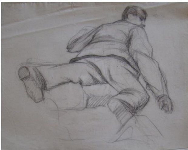
➤ Etude d'homme mort Crayon sur papier : 47 x 62 cm Non signé Clapiers, collection privée Inv. DSC 04459 – Série 6

En effet, Leenhardt perfectionna son enseignement académique en voyageant en Europe et en visitant divers ateliers de grands peintres et académies de peinture. Mais, c'est lors de son séjour à Constantinople qu'il a l'occasion d'observer les condamnés à mort et des exécutions publiques 10 . Celles-ci lui permettront d'observer et de rendre avec une fidélité toute photographique les traits d'un mort. Des dessins préparatoires ont été retrouvés.