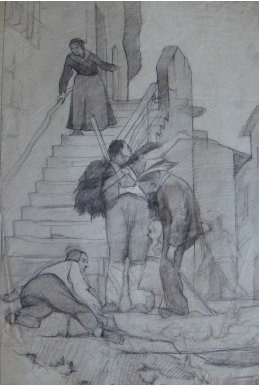
➤ Etude de composition du Meurtre au village Crayon sur papier : 47 x 62 cm Non signé Clapiers, collection privée Inv. DSC 04471 – Série 7