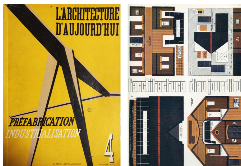
Couvertures de la revue Architecture d'aujourd'hui (1) «Préfabrication, industrialisation», n°4, Janvier 1946 (2) «Vers une industrialisation de l'habitat», n°148, Décembre-Janvier 1970

Nous formulons l'hypothèse selon laquelle le processus d'industrialisation de la construction opèrerait le passage d'un usage des trames comme grille « rigide » limitée à une application en deux dimensions, à celui de la trame comme base des systèmes pensés en trois dimensions et donc de la modulation. En effet, la conception de l'objet industrialisé oblige l'architecte à penser en amont la combinatoire parfaite des éléments dans le but d'obtenir une réalisation architecturale rationalisée, et donc à penser l'espace plutôt que le plan.