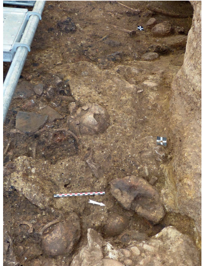
Figure 4 - Structure en terre crue sous la forme d'une coulure de terre massive associée à des éléments modulaires qui viennent recouvrir et enchâsser les squelettes.