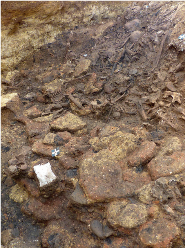
Figure 2 - Vue depuis le nord d'un effondrement de briques de terre crue plus ou moins chauffées sur des squelettes majoritairement en connexion.