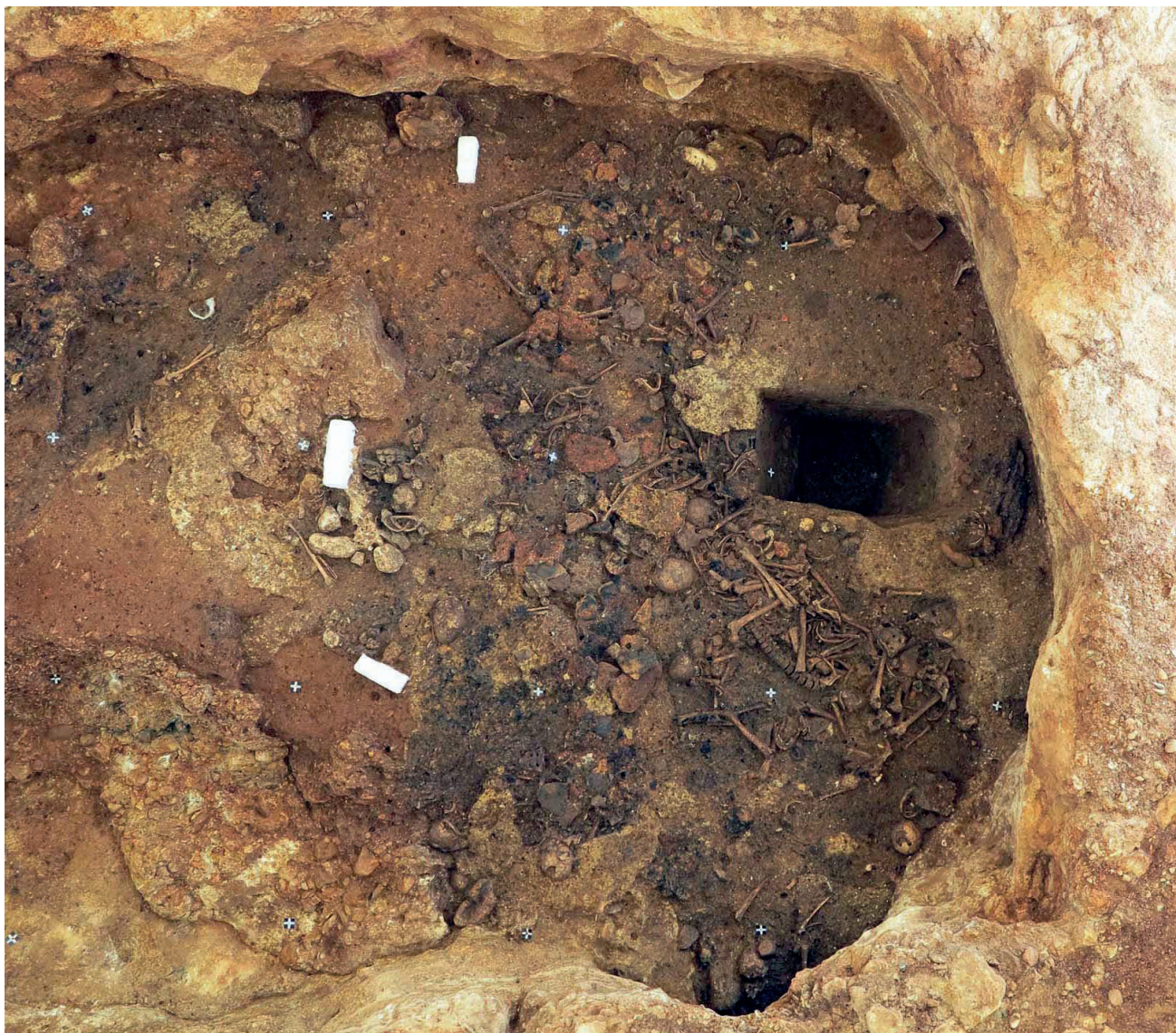
Figure 1 - Vue zénithale de la moitié sud de la cavité. Variété du faciès sédimentaire composé d'amas de briques.

Le référencement sur chaque décapage technique des différents « us » ou « TC » est assurée par le biais de prises de vue photogrammétriques. C'est à partir de ces levés qu'est effectuée la reconstitution stratigraphique et planimétrique rendue nécessaire par la fouille en carrée,