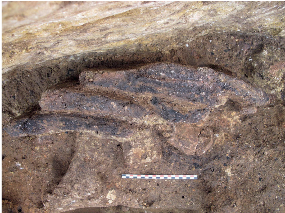
Figure 3 - Tronçon d'élévation en terre crue modulaire non chauffée, conservé sur une hauteur de 4 assises. L'agencement initial des modules est parfaitement lisible.