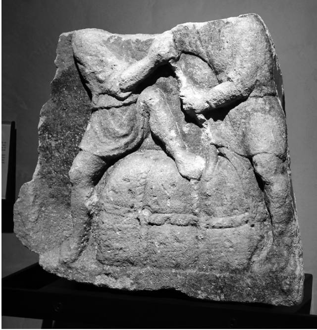
Fig. 2. Le relief des débardeurs (Esp., I, 164).

elle ne prêterait pas une attention suffisante à la nature des épitaphes conservées et aux parcours individuels accomplis. Comme beaucoup d'armateurs et d'hommes d'affaires arlésiens, Pardalas et Euporus furent des esclaves, qui s'élevèrent dans leur société d'origine, dans les années postérieures à leur affranchissement. La question n'est donc pas seulement de juger s'ils étaient exceptionnels ou non, à leur mort, mais de tenter aussi de déterminer à partir de quand ils auraient cessé d'être « ordinaires ».