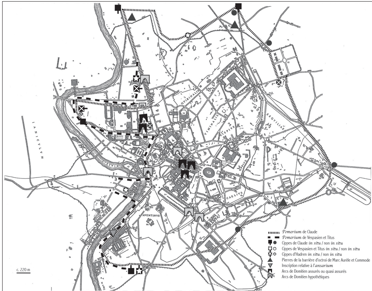
Fig. 1. Le pomerium sous Claude et Vespasien.

tions du Champ de Mars), la principale nouveauté du pomerium flavien résidant dans l'incorporation d'une zone du Trastevere, à hauteur de Santa Cecilia (même si le cippe ici mis au jour n'a pas été retrouvé in situ ), mais aussi d'une partie du Champ de Mars central sise à l'ouest de la Via Flaminia (dans le quartier de Montecitorio). La concomitance entre le tracé étendu par les deux premiers Flaviens et la localisation supposée des arcs de Domitien a quelque chose de frappant.