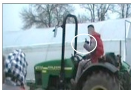
Figure 2 : Mouvement de la main gauche représentant symboliquement l'action de la jambe droite

L'enseignant décompose lentement chaque mouvement réalisé et le verbalise. Mais si ce dernier est difficilement observable par les élèves (accélération avec le pied à l'opposé des apprenants, voir Figure 2), l'enseignant ajoute également un mouvement avec sa main facilement visible qui vise à représenter symboliquement l'action de sa jambe. Par ailleurs, lorsque l'enseignant réalise un mouvement directement observable par les élèves, il s'attache à guider leur regard en pointant du doigt la partie de son corps qui l'exécute (voir Figure 3). Ainsi, les savoirs en jeu ne sont pas seulement montrés et verbalisés. Cet enseignant guide les élèves dans leur observation par une communication non verbale détaillée lui permettant de rendre visibles les composantes critiques du savoir (mouvement de la main pour montrer l'accélération progressive faite avec le pied droit, doigt montrant sa jambe gauche appuyant sur la pédale d'embrayage...). Les élèves ensuite en action questionnent principalement l'enseignant sur l'ordre des opérations à réaliser plutôt que sur les conditions de leur mise en œuvre. Sébastien l'explique notamment par le fait que les apprenants « n'osent pas » faire sans demander confirmation, car « ils savent qu'ils n'ont pas trop droit à l'erreur parce que le tracteur appartient à l'exploitation agricole [...] ».