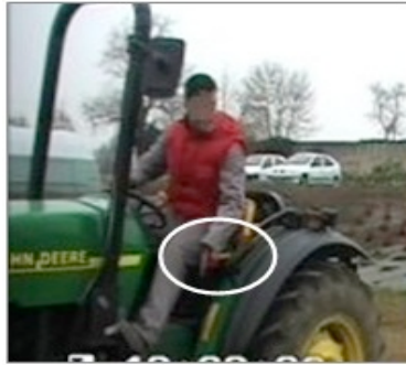
Figure 3 : Mouvement de la main gauche désignant l'action de la jambe gauche

Figure 3: Movement of the left hand describing the action of the left leg