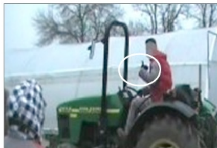
Figure 2 : Mouvement de la main gauche représentant symboliquement l'action de la jambe droite

L'enseignant décompose lentement chaque mouvement réalisé et le verbalise. Mais si ce dernier est difficilement observable par les élèves (accélération avec le pied à l'opposé des apprenants, voir Figure 2), l'enseignant ajoute également un mouvement avec sa main facilement visible qui vise à représenter symboliquement l'action de sa jambe. Par ailleurs, lorsque l'enseignant réalise un mouvement directement observable par les élèves, il s'attache à guider leur regard en pointant du doigt la partie de son corps qui l'exécute (voir Figure 3). Ainsi, les savoirs en jeu ne sont pas seulement montrés et verbalisés. Cet enseignant guide les élèves dans leur observation par une communication non verbale détaillée lui permettant de rendre visibles les composantes critiques du savoir (mouvement de la main pour montrer l'accélération progressive faite avec le pied droit, doigt montrant sa jambe gauche appuyant sur la pédale d'embrayage...). Les élèves ensuite en action questionnent principalement l'enseignant sur l'ordre des opérations à réaliser plutôt que sur les conditions de leur mise en œuvre. Sébastien l'explique notamment par le fait que les apprenants « n'osent pas » faire sans demander confirmation, car « ils savent qu'ils n'ont pas trop droit à l'erreur parce que le tracteur appartient à l'exploitation agricole [...] ».