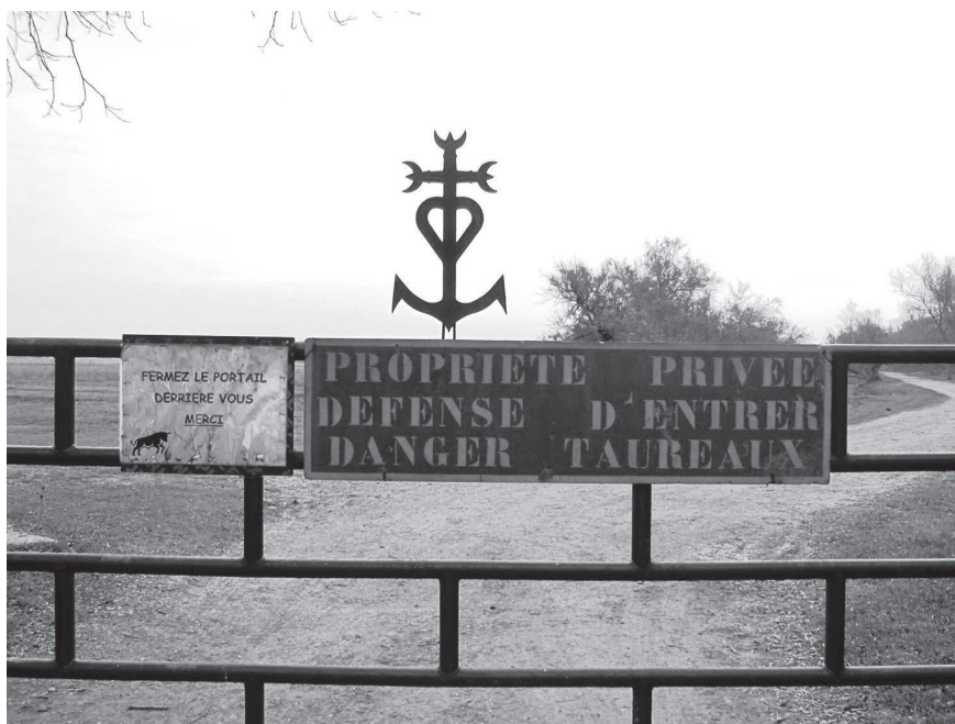
Figure 1. Chemin public ou privé aux prés à taureaux? Photo: C. Clément, 2012.