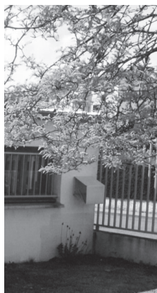
Figure 4. La boîte aux lettres du jardin des Moineaux.