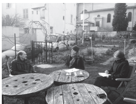
Figure 3. Le jardin de la Clé, un portillon fermé mais ouvert... Photo: M. Grenet, 2014.