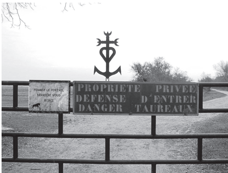
Figure 1. Chemin public ou privé aux prés à taureaux? Photo: C. Clément, 2012.