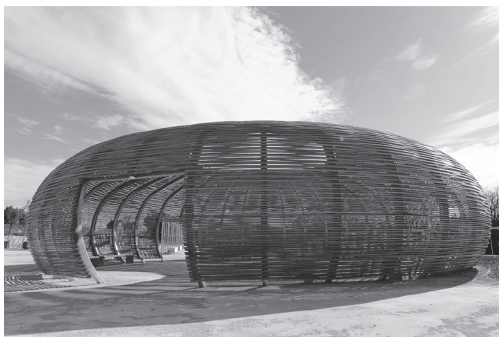
Figure 2. Le patio du pôle œnotouristique du Lunellois.