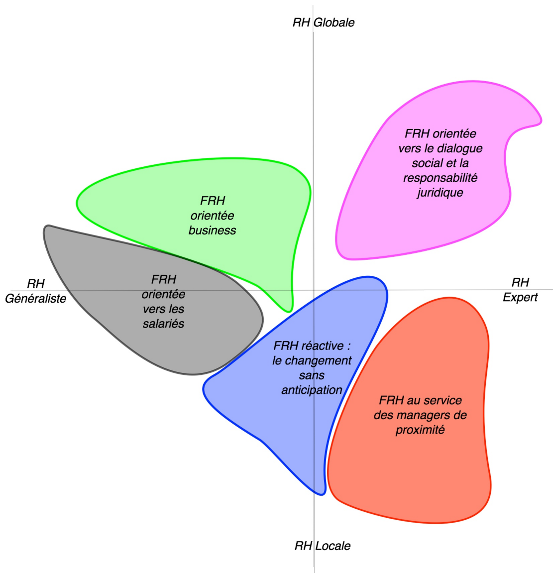
Figure 3 – Devenir de la fonction RH Typologie des discours des DRH « locaux »