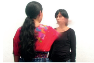
Fig. 2. Hermana , 2010. (vidéo : José Juárez)