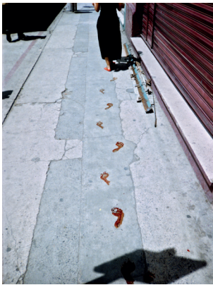
Fig. 1. ¿Quién puede borrar las huellas? , 2003.

La deuxième modalité s'articule autour de la réapparition, de la notion de restes. Avec ¿Quién puede borrar las huellas? (2003), Galindo prétend dénoncer la candidature à la présidence de la République du Général et ancien chef d'État Efraín Ríos Montt qui gouverna le Guatemala de 1982 à 1983, une des périodes les plus meurtrières du conflit armé marquée par la mise en place de la pratique de la « terre brûlée ». L'artiste, après avoir trempé ses pieds dans une bassine de liquide rouge écarlate, parcourt la capitale guatémaltèque de la Cour Constitutionnelle jusqu'au Palais National.