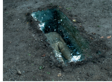
Fig. 5. Suelo común , 2012.

Les traces ensanglantées laissées sur son passage constituent une métaphore des victimes de la guerre qu'il est impossible d'ignorer malgré une politique de la mémoire tournée vers l'oubli institutionnalisé. Galindo a également réalisé de nombreuses performances autour du thème des fosses communes qui renvoient aux exhumations qui ne cessent d'alimenter l'actualité, non seulement au Guatemala mais aussi en Slovénie où elle monte Suelo común (2012). Elle occupe ici une tombe clandestine recouverte par une vitre transparente sur laquelle marchent les passants.