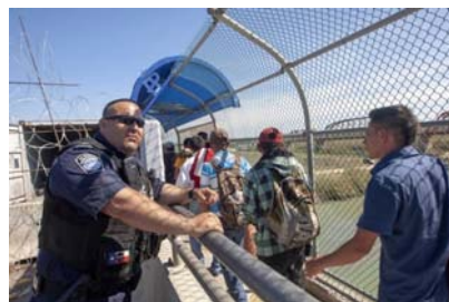
Migran Amerika Tengah dalam perjalanan menuju Amerika Serikat (di Meksiko, pada bulan Februari 2019, di Piedras Negras, Coahuila ).

Semua imigran (pendatang di suatu negara) juga adalah emigran (orang pindah/keluar) dari negara asal mereka. Namun informasi yang tersedia untuk menghitung emigran pada tingkat negara tertentu seringkali kualitasnya lebih buruk daripada informasi untuk imigran, meski pada tingkat global mereka mewakili kumpulan orang yang sama. Negara-negara mungkin kurang peduli tentang penghitungan emigran daripada para imigran mereka, mengingat bahwa yang pertama, tidak seperti yang terakhir, bukan lagi penduduk dan tidak menggunakan layanan atau infrastruktur publik yang didanai pemerintah.