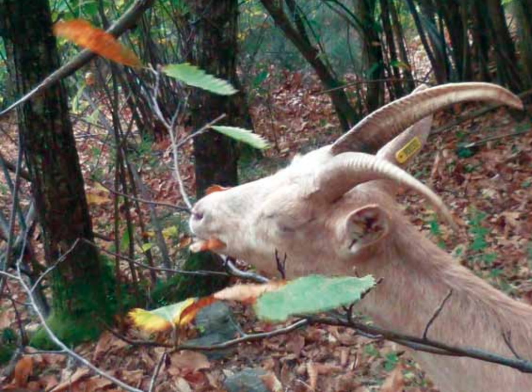
En été elles mangent les feuilles (ici de châtaignier).