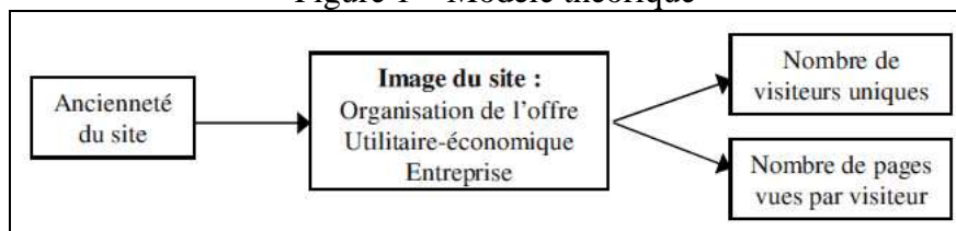
Figure 1 – Modèle théorique

Les trois facteurs principaux de l'image transmise du site sont des variables endogènes lorsque l'on examine l'effet de son antécédent, et des variables exogènes pour ce qui concerne ses conséquences. Une série de régressions simples a été effectuée pour analyser l'effet de l'ancienneté sur le marché, et une régression multiple pour tester l'effet sur la performance du site (Tableau 5). Afin d'éviter tout problème d'hétéroscédasticité concernant le nombre de visiteurs uniques annuels (très forte variance entre les sites étudiés), cette variable a subi une transformation logarithmique.