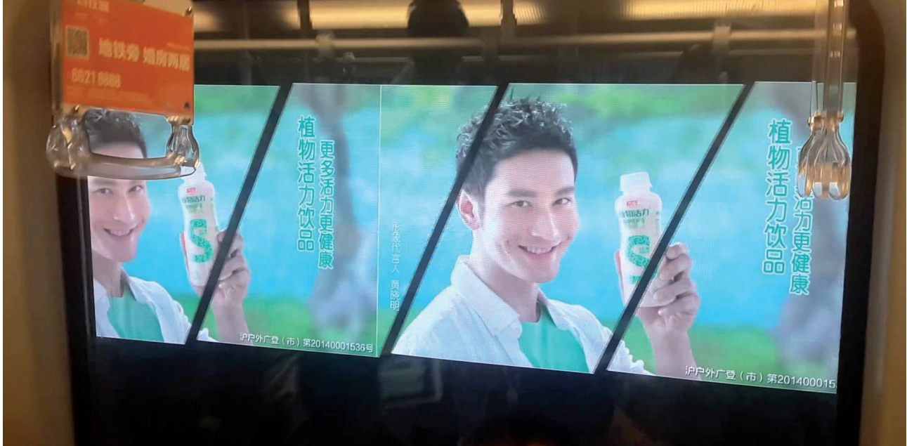
La publicité dans le métro de Shanghai. Photo DR. C-dessous, le calendrier du budget participatif de la ville de Paris. DR

création ont connu une croissance véritablement exponentielle à partir de 2011 14 .