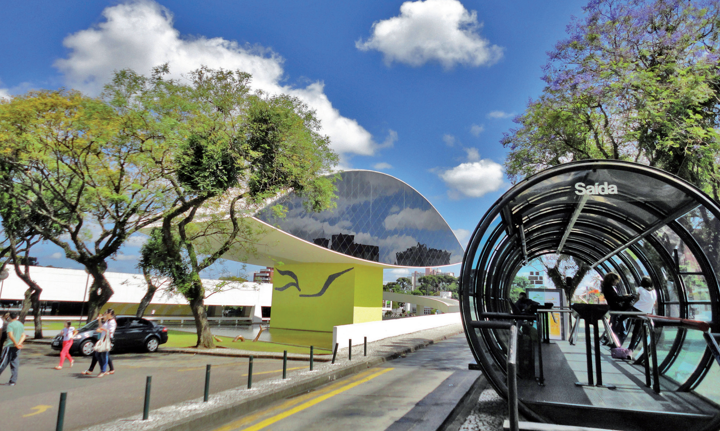
Le métro de surface de Curitiba.

Enfin, les expériences ont ceci d'intéressant qu'au-delà de leur propre application, elles rappellent, mis à part dans le cas particulier des villes créées ex nihilo , la continuité de la construction du fait urbain et imposent, plutôt que d'oublier quelque peu celui-ci, la nécessité de laisser l'habitant au centre du projet : les villes intelligentes seraient donc d'abord l'affaire des citoyens.