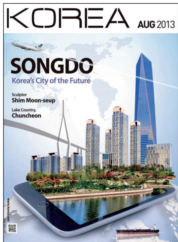
Songdo la « ville du futur », Corée du Sud.

« villes vitrines » de grands industriels et architectes, construites ex nihilo , presque comme des systèmes autonomes, avec une société et une citoyenneté à construire, faisant la part belle à l'architecture, aux transports collectifs, aux énergies renouvelables, à la domotique 5 , au recyclage et évidemment au partage d'informations, de nombreuses expériences, peut-être moins ambitieuses mais pragmatiques, sont déployées partout dans le monde, au sein de villes et de communautés en construction permanente.