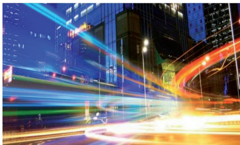
Réseaux urbains. Photo DR

Notamment poussée par les industriels voyant en elle de nouveaux marchés à très forts potentiels, l'expression Smart Cities semble aujourd'hui pleinement appropriée par les grandes collectivités et leurs élus, à la fois dans l'objectif évidemment louable d'optimiser leur fonctionnement et leurs services mais aussi, parfois dans le cadre de ce qui ressemble fort à du marketing territorial. Dans le même temps, il est du rôle du chercheur en sciences humaines, et particulièrement en géographie, de s'interroger sur la pertinence de ce nouveau concept que certains – dont les industriels pré-cités – voudraient presque ériger au rang de paradigme en matière de gestion urbaine et d'usages