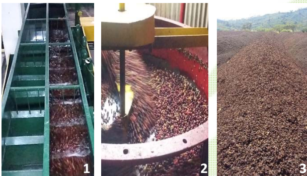
Production du café vert par voie humide : (1) entraînement à l'eau des cerises de café ; (2) callibrage avant dépulpage/démucilage des grains ; (3) stockage à l'air des coproduits (pulpe, peau, mucilage).

Objectif : mise en place et évaluation d'une stratégie de traitement de la pulpe de café pour en extraire les acides chlorogéniques (ACG) et la détoxifier (forte charge organique, polyphénols et caféine) en privilégiant l'utilisation de procédés sobres en termes de consommation énergétique et d'empreinte environnementale.