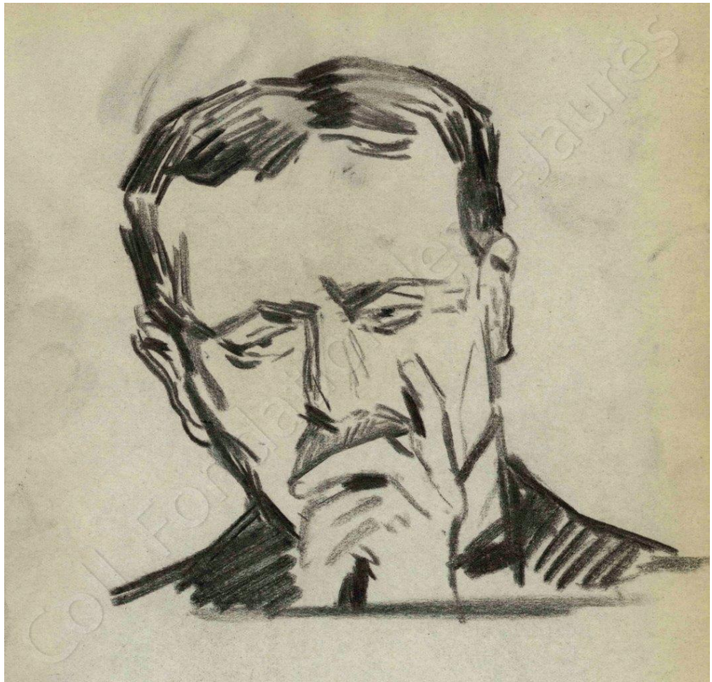
Raoul Villain à son procès, par Lucien Jonas.

Issu de la même génération que Jean Jaurès malgré le relatif écart d'âge qui l'en sépare, Joseph Paul-Boncour est, comme lui, assez tardivement venu au socialisme. Si le second a un temps frayé avec les républicains opportunistes, le premier a d'abord gravité dans l'orbite des radicaux. Tous deux sont par ailleurs issus d'un milieu bourgeois, quand bien même la famille de Joseph Paul-Boncour était financièrement plus à l'aise que celle de Jean Jaurès. Le parallélisme des trajectoires n'épuise certainement pas à elle seule les ressorts de la convergence politique et personnelle qui intervient à la veille de la Grande Guerre. On ne peut néanmoins s'empêcher de considérer qu'elle y a pris sa part. Cette proximité, réelle ou supposée, facilite l'élaboration par Joseph Paul-Boncour d'un modèle de référence idéologique à partir de la pensée de Jean Jaurès qu'il théorise lors du procès Raoul Villain et qui se veut une contribution à la redéfinition de l'identité doctrinale et de la culture politique de la SFIO.