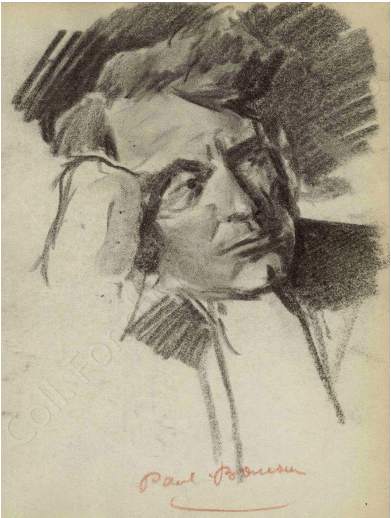
Joseph Paul-Boncour au procès Villain, par Lucien Jonas.