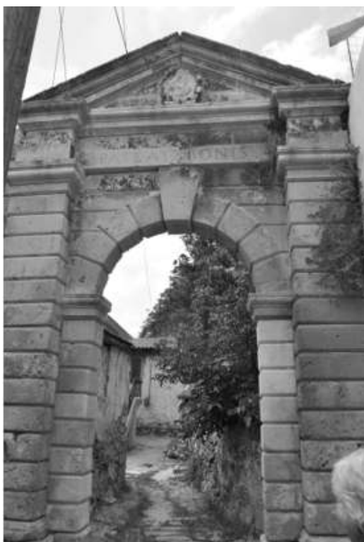
Figure 3. Village de Pikris, villa Clodia (XVI e s. ?), photo du portail