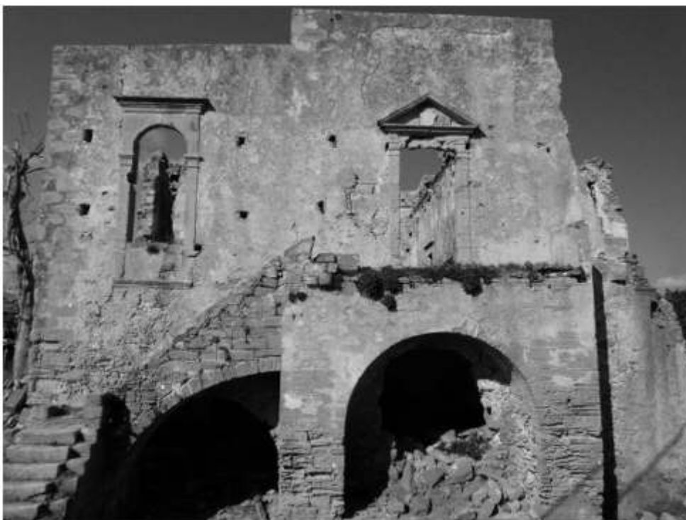
Figure 2. Village de Cato Drapanias, villa Trevisan (xvi e s. ?), photo de la façade