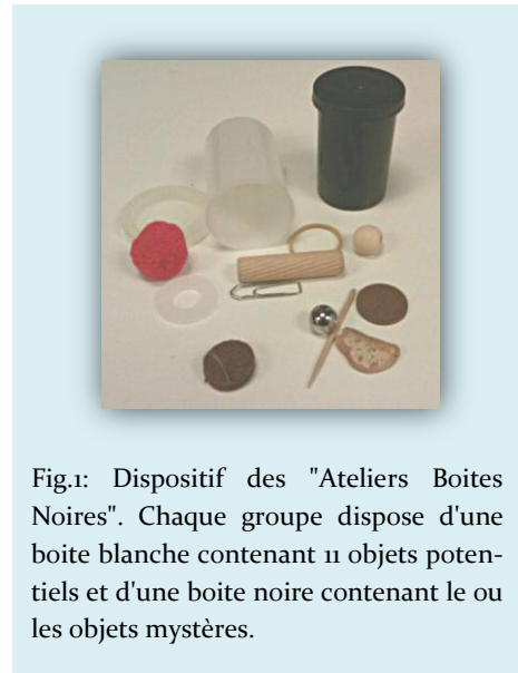
Fig.1: Dispositif des "Ateliers Boîtes Noires". Chaque groupe dispose d'une boîte blanche contenant 11 objets potentiels et d'une boîte noire contenant le ou les objets mystères.

Les trois ateliers proposés ont le même dispositif (Fig.1). Chaque groupe d'étudiants dispose d'une boîte blanche contenant onze objets, monde en réduction que les étudiants peuvent ouvrir afin d'en étudier les caractéristiques. Il s'agit de la phase d'exploration. Ils disposent également d'une boîte noire renfermant un objet mystère choisi parmi les onze objets potentiels de la boîte blanche. La boîte noire, bien sûr, ne doit pas être ouverte durant l'atelier. Elle sera l'objet d'une étude ayant pour but de déterminer la nature de l'objet mystère qu'elle contient.