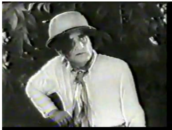
Fig. 1 – K. L. Saigal