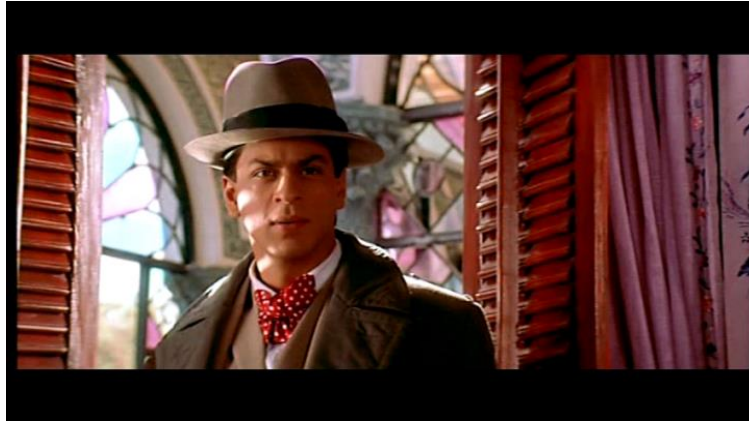
Fig. 3 Shahrukh Khan, 2002