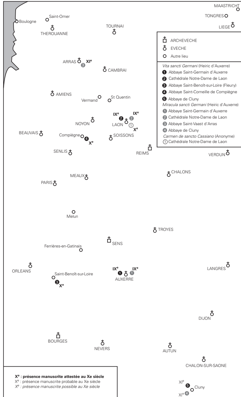
Carte 2: répartition des manuscrits renfermant la Vita sancti Germani d'Heiric d'Auxerre et le Carmen de sancto Cassiano à l'époque de Dudon de Saint-Quentin.