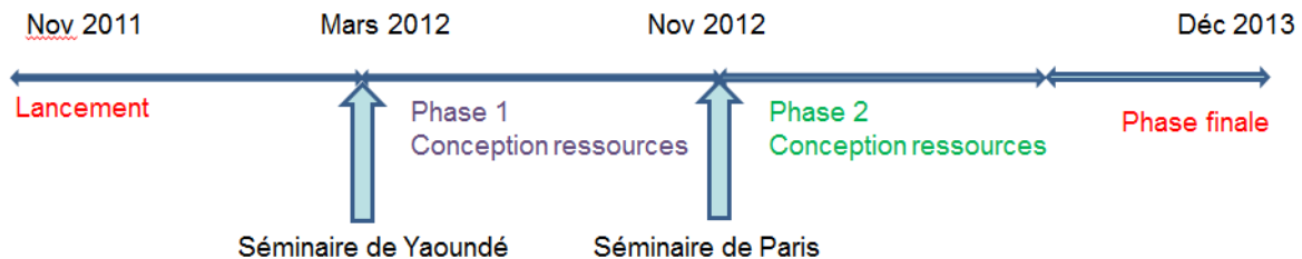
Figure 1 : Déroulement du projet pour la première vague de ressources

La sensibilisation à la didactique des mathématiques et aux TICE des participants au projet a fait l'objet de plusieurs séminaires. Le premier, le séminaire de Yaoundé (mars 2012), avait trois objectifs : une approche de la didactique, l'utilisation de la plateforme numérique WIMS et la conception de ressources destinées à des enseignants de terminale scientifique. Le deuxième, le séminaire de Paris (novembre 2012), avait pour enjeu de favoriser la concertation entre les différents pôles du projet (France, Cameroun, Congo-Brazzaville) sur l'avancement des ressources en relation avec les apports en didactique des mathématiques et en TICE (cf. figure 1).