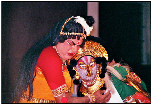
Scène de « Jatayu Moksha »

3/ les poèmes qui conduisent à des dialogues improvisés : la majeure partie des poèmes d'un prasaṅga appartient à cette catégorie. Dans un premier temps, l'acteur illustre le contenu du poème en le dansant. Puis, au terme de ce passage chanté/dansé, il prolonge et enrichit le poème en improvisant un texte. Ces poèmes informent sur l'identité du personnage qui parle ; en effet, les expressions comme « dit Arjuna » ou « a déclaré Indrajitu » apparaissent comme des parties de la chanson et sont entonnées par le Bhāgavat .