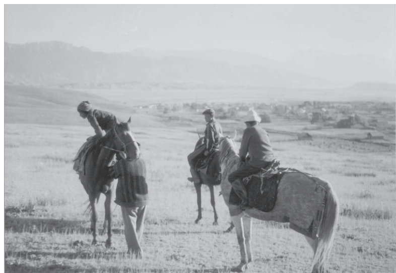
Séance d'entraînement au Kirghizstan. L'un des trois chevaux est vêtu d'une couverture pour activer la sudation 19

Les entraîneurs, eux, sont nommés différemment suivant les régions : atbegi dans le Centre et l'Est du Kazakhstan, at sejne ou sejne dans l'Ouest, bapker au Sud, sejs à Turgaj ( at ) sejis 16 , saâpker au Kirghizstan. Leur rôle est primordial, car la course sur longue distance représente une véritable épreuve pour le cavalier et sa monture. Les chevaux doivent avoir subi un entraînement spécifique dont l'absence ou l'insuffisance peut être fatale. La date des courses importantes est annoncée un à deux mois à l'avance 17 afin de permettre cette préparation. L'art de l'entraîneur consiste à savoir doser nourriture, abreuvement, travail et repos en fonction des caractéristiques de chaque cheval. En Asie centrale, l'entraînement se compose d'une alternance de phases d'engraissement et d'amaigrissement. Il se conçoit comme un processus d'assèchement de l'animal, phénomène dont les progrès se manifestent par l'évolution de la sudation et qui se base sur un jeu subtil du chaud et du froid, du sec et de l'humide 18 .