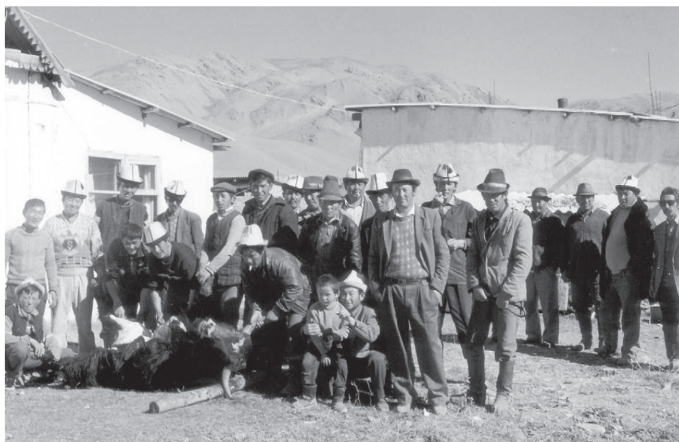
Abattage du yak gagné aux courses 158

un yak, deux chameaux, quatre chevaux, quinze moutons, trois tapis et l'équivalent de 500 francs français offerts par un « sponsor ». Le lendemain, il avait déjà tout distribué à des parents, abattu et mangé le yak pour fêter sa victoire, ne gardant pour lui-même qu'un cheval et un tapis.