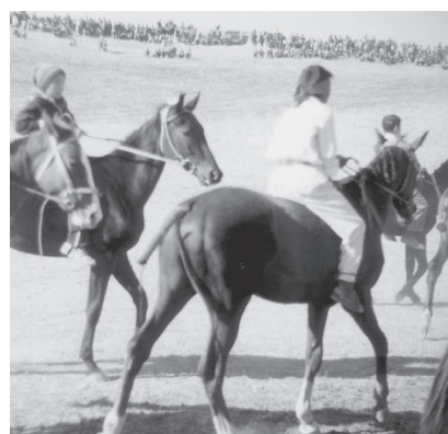
Même couleur rouge, ci-dessus, pour le bandage de queue, le tressage de la crinière, le toupet et le bandeau du cavalier.

Les crins de la queue sont pliés puis bandés avec un tissu blanc ou rouge, une fine mèche longue étant laissée libre 147 . Le toupet (kaz. kekil ) est également bandé de manière à se dresser