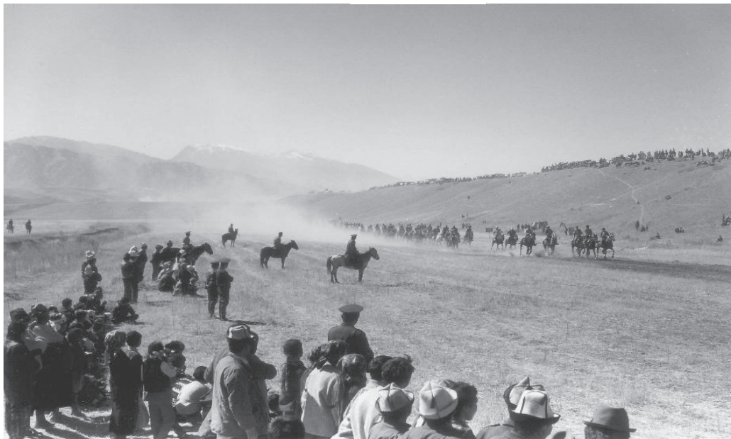
Courses dans la région de Naryn, Kirghizstan 157

concurrents montent plus souvent avec une selle et non à cru 156 , les poulains ne courent pas avant l'âge de deux ans, les distances sont généralement plus réduites ; et d'ordre socio-économique : les prix sont moins importants. Depuis l'indépendance, le fossé n'a fait que croître entre les deux voisins dont les niveaux de vie sont très hétérogènes. Cette différence de moyens incite certains propriétaires kirghizes à engager leur champion chez leurs voisins kazakhs.