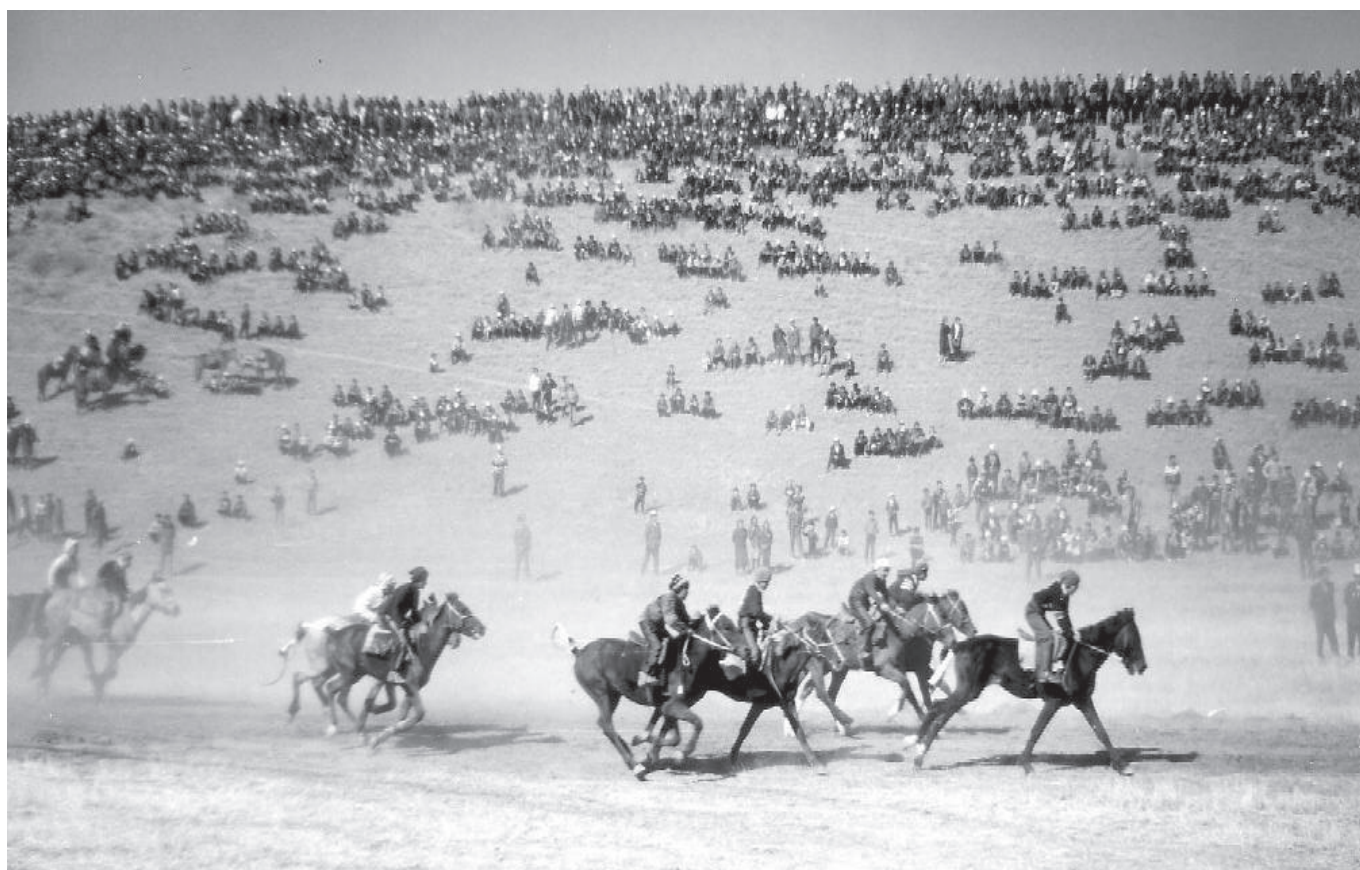
Course de poulains au Kirghizstan 76