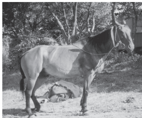
Maradona, avec et sans sa couverture de course 164