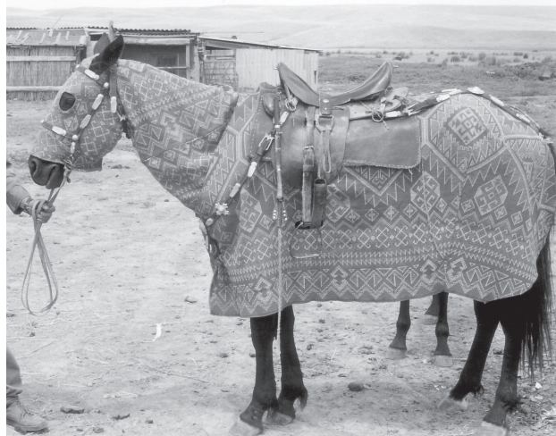
ķûlakşyn et żabu 145