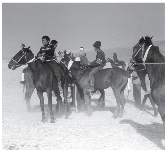
Chevaux toilettés avant la course 146