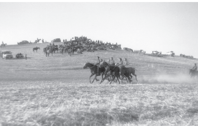
Alaman bājge 153