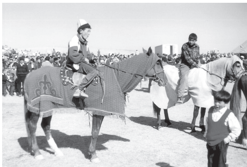
Chevaux couverts avant la course