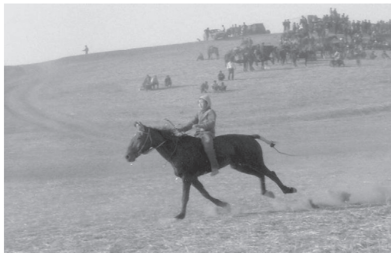
Alaman bājge 153