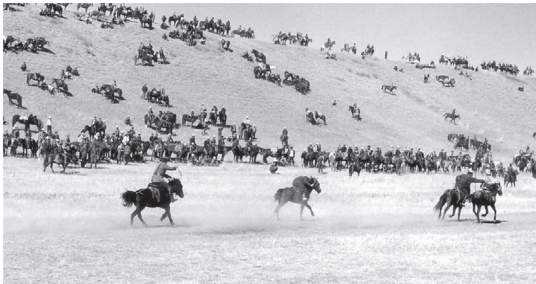
Un arbitre et un militaire rattrapent deux concurrents attardés pour les expulser 138

bäjge , aux dépens des courses de courtes distances, associées à l'influence russe. Les compétitions se multiplièrent, organisées non seulement par des particuliers, mais aussi par des administrations locales et nationales, à l'occasion de fêtes célébrant le folklore, la culture, l'histoire locale ou nationale. La mise en œuvre de ces manifestations hippiques représente un enjeu politique non négligeable, une occasion de glorifier les signes de l'identité collective que les autorités n'ont pas manqué de saisir.