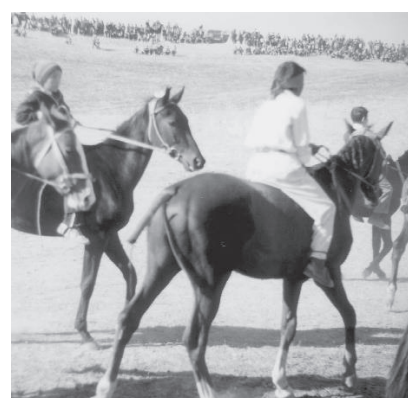
Même couleur rouge, ci-dessus, pour le bandage de queue, le tressage de la crinière, le toupet et le bandeau du cavalier.

Les crins de la queue sont pliés puis bandés avec un tissu blanc ou rouge, une fine mèche longue étant laissée libre 147 . Le toupet (kaz. ķekil ) est également bandé de manière à se dresser