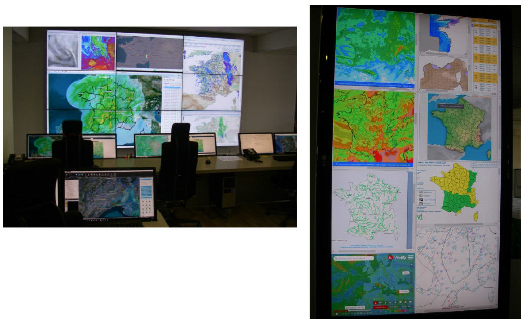
Figure 1. Recueil des besoins en visualisation en salle de crise de la société PREDICT: visualisation de représentations cartographiques multiples, et de données incertaines