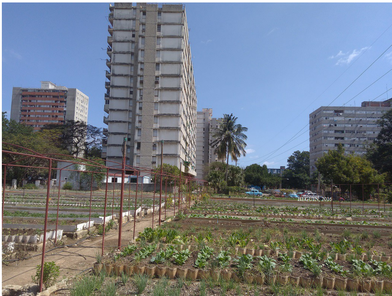
1. Organopónico « La Sazon » à La Havane (Béguin, 2017)

Les résultats de cet article sont le fruit de la collecte de données, d'enquêtes et d'entretiens (travailleur-se-s des organoponicos, habitant-e-s, consommateur-trice-s, gestionnaires administratif-ve-s) menés à La Havane de novembre 2016 à mai 2017 dans cinq organoponicos (OP) : l'OP « 1ro de Julio », dans le municipio Cerro ; l'OP de « Alto rendimiento », et l'OP « 5ta y 44 », dans le municipio Playa ; l'OP de « La Sazon », et l'OP « 5to Congreso », dans le municipio Plaza de la Revolución.