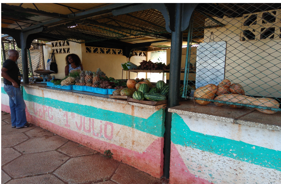
3. Point de vente de l'organoponico « 1ro de Julio » (Beguin, 2017)

Le mode de fonctionnement des organoponicos rapproche consommateur-trice-s urbain-e-s et producteur-trice-s agricoles. Sur les 96 organoponicos recensés en 2016 (170 ha), et les 785 travailleur-se-s de La Havane, un quart (194) sont des femmes, qui travaillent souvent dans les points de vente ou en tant que cuisinière. Quant à l'âge des travailleur-se-s, plus de 71 % ont entre 35 et 65 ans, 9 % plus de 65 ans, et moins de 20 % ont moins de 35 ans. La moitié des travailleur-se-s a plus de 50 ans. Cette population vieillissante interroge l'avenir des organoponicos dans un contexte marqué par le manque d'attrait du métier chez les jeunes. Les travailleur-se-s possèdent essentiellement un niveau de formation lycée (41 %) ou collège (40 %) et très peu possèdent une formation en relation directe avec le travail dans les organoponicos. La plupart avaient déjà travaillé la terre de façon traditionnelle, et passé leur enfance à la campagne. Tous ont dû se former aux principes écologiques.