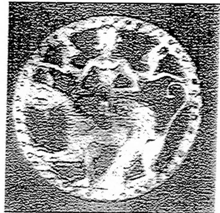
Cachets de Bactriane