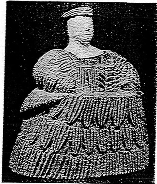
Statuette de déesse