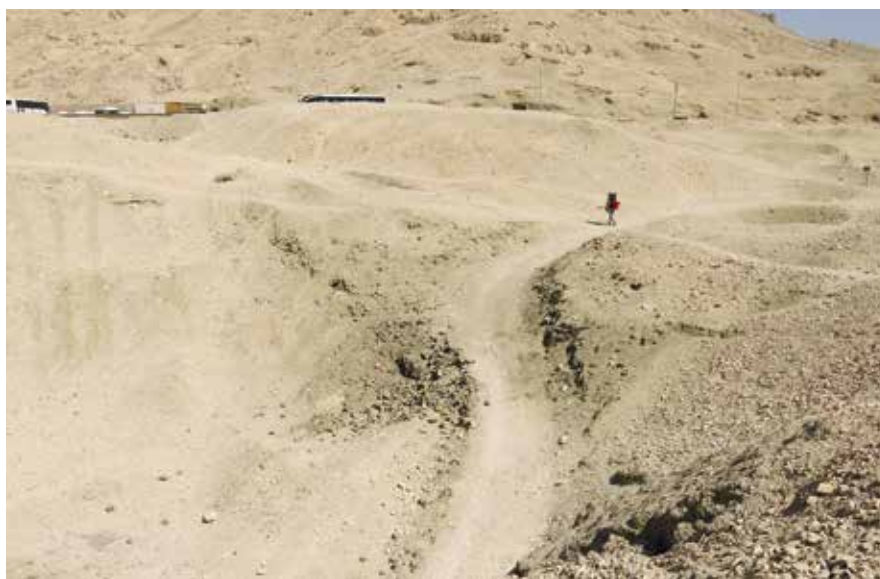
Fig. 2. Survey dans la zone du pylône coupé par le chemin moderne. La structure n'est plus clairement reconnaissable.