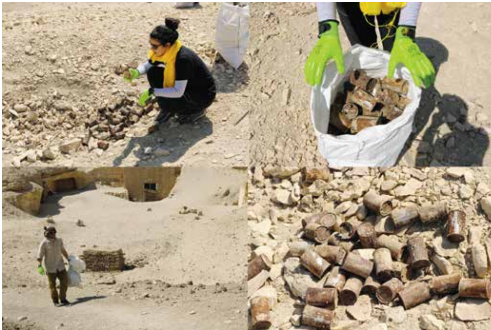
Fig. 3. Nettoyage des déchets métalliques modernes.

Le matériel utilisé est un dispositif multi-capteurs développé par l'UMR 7516 IPGS. Ce dernier permet la mesure du champ magnétique à 80 cm au-dessus du sol simultanément selon 4 profils d'acquisition parallèles et espacés de 50 cm. Le positionnement est assuré par un système de GNSS différentiel. La mesure permet d'établir une carte des anomalies magnétiques liées aux hétérogénéités du sous-sol. Un système mono-capteur est également utilisé en complément comme station de référence afin d'enregistrer les perturbations temporelles du champ magnétique sur le site, qui peuvent ainsi être corrigées en laboratoire lors du traitement après la prospection. L'utilisation de cette méthode a nécessité de procéder à un grand nettoyage des déchets métalliques modernes qui jonchaient la surface du site archéologique, afin d'éviter que ces débris ne perturbent le signal magnétique. Pas moins de cinq sacs de 50 l de déchets ont ainsi été collectés (fig. 3).