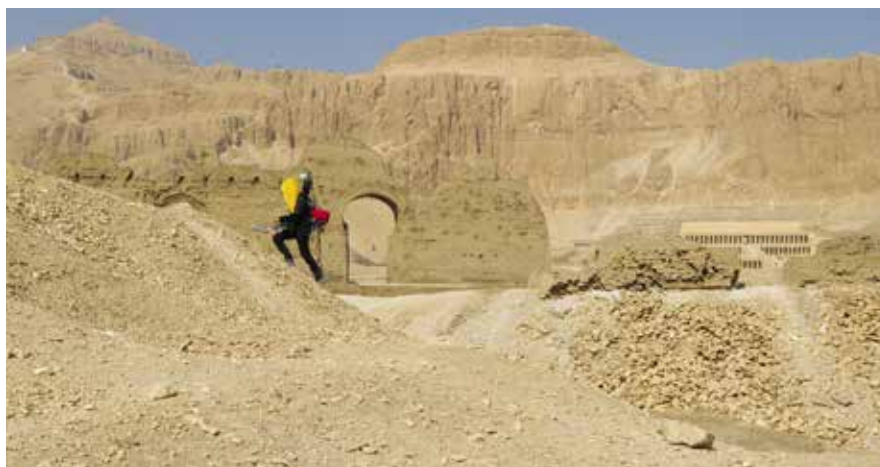
Fig. 1. Équipement géophysique (magnétomètres géolocalisés) développé par l'UMR 7516 Institut de physique du globe de Strasbourg, survey à l'intérieur de l'enceinte de la tombe de Padiaménopé.

L'objectif de la prospection était d'étudier, en surface du site, les structures archéologiques situées au-dessus et autour des tombes TT 33, 242 et 388, de commencer à vérifier la validité du plan de cette zone publié par Dieter Eigner en 1982 et de repérer d'éventuelles structures, principalement en briques crues, invisibles à la surface du sol. Dans ce but, une surface de 1,5 ha a été prospectée au moyen d'une méthode de mesure de l'intensité du champ magnétique capable de détecter de faibles contrastes du magnétisme en parcourant une vaste surface sur un terrain accidenté en un temps très court (fig. 1, 2).