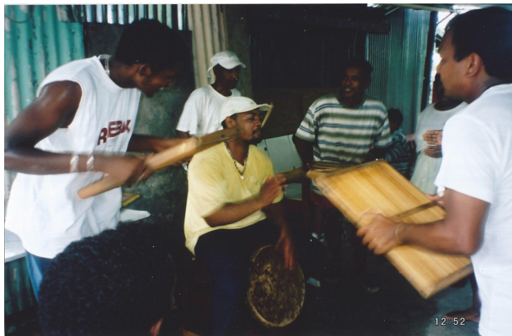
Formation maloya, de g. à d. : kayamb , pikèr , roulèr , kayamb , battements de main, kayamb

En effet, les témoignages associent toujours le bob à une expression solitaire distincte des rassemblements musicaux dans lesquels un collectif joue et chante le maloya à proprement parler. Si on le retrouve aujourd'hui associé à cet orchestre traditionnel, c'est à mon sens du fait de la fonction emblématique de l'africanité qu'il remplit. Son caractère immémorial en fait par exemple un symbole de la primauté et l'aïnesse des cultures africaines sur celles européennes comme l'atteste la théorie paléanthropologique « out of Africa » 5 . Connotant la résistance à l'aliénation coloniale, cette dimension identitaire fut valorisée à partir des années 1960, moment où la revendication politique insulaire s'organisa en faisant appel à la force