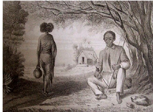
Lithographie d'Antoine Roussin, XIX e siècle.