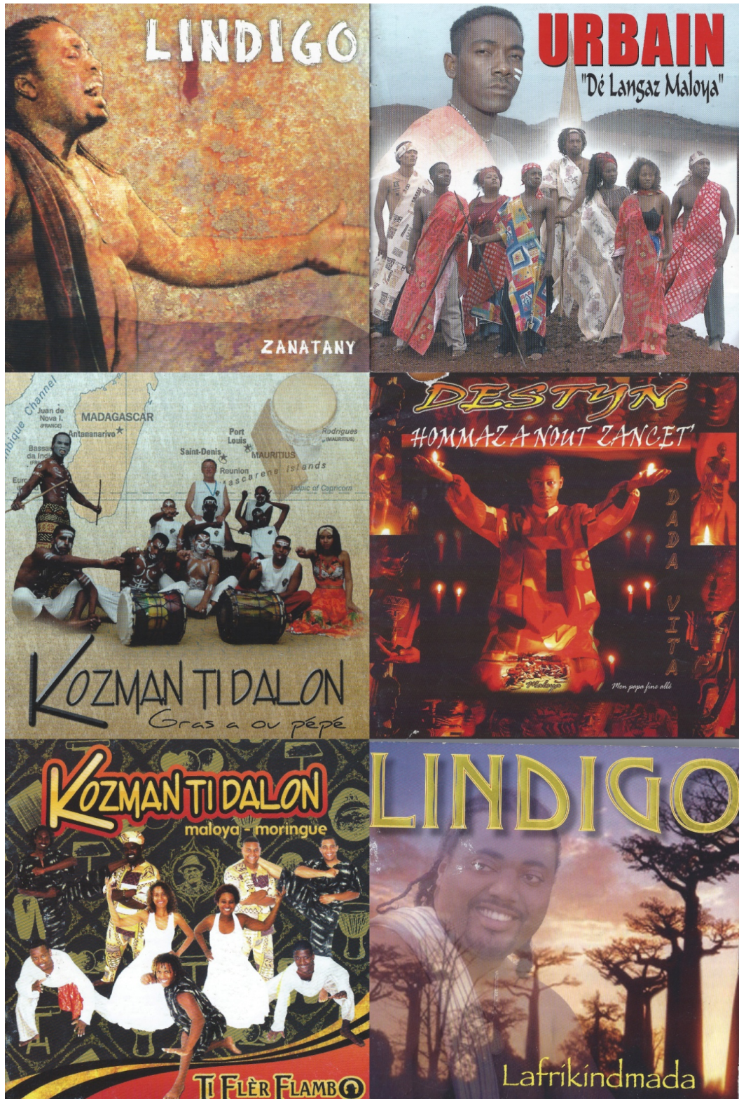
Pochettes de disques CD, 2002-2008.

ne cesse de se faire palpable. On lui donne d'ailleurs deux noms selon les partis pris : « Fête Kaf » ou « Fête Réunionnaise de la Liberté ». En un sens elle suit les lignes de faille d'une société où contrastent des modes de vie allant des plus hauts revenus aux plus forts taux de chômage et d'illettrisme de France.