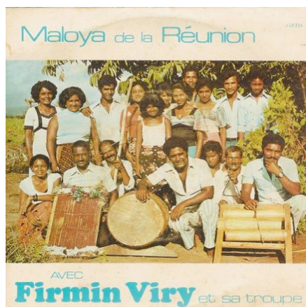
Pochette de disque 45t, 1979.

Chant soliste, Chant du chœur , Chant des deux parties ensemble