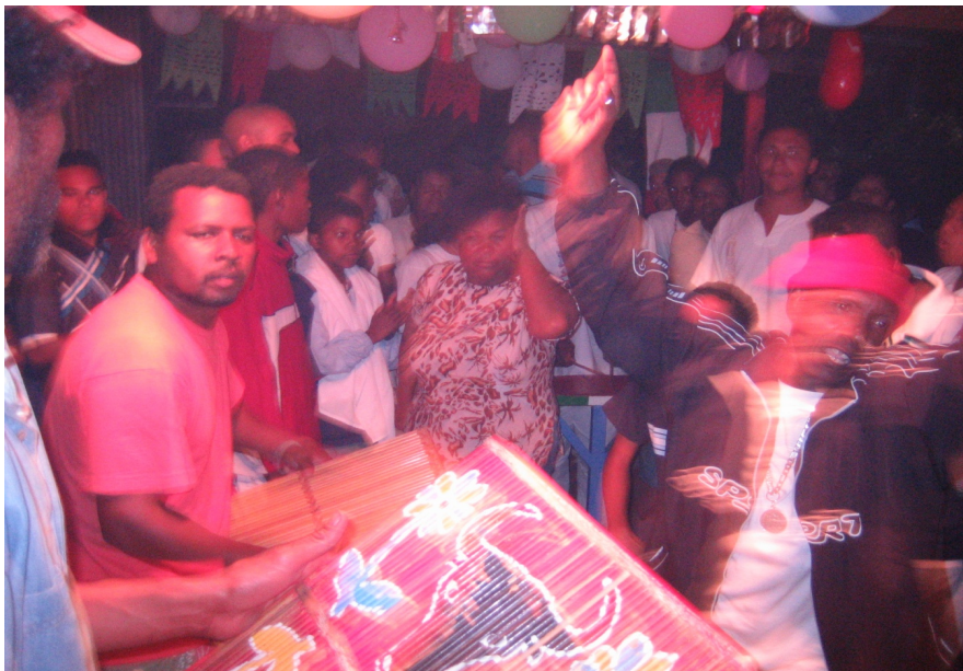
Service malgache à Saint-André en octobre 2005

religions créoles du Nouveau Monde, ces cérémonies de possession ne renvoient pas à un panthéon fixe de divinités. Comme à Madagascar, ce sont les ancêtres de la famille (3 ou 4 générations au dessus d'égo) que leurs descendants ou leurs initiés prient (Dumas-Champion, 2008). On y sert des mets et des boissons aux vivants ainsi qu'aux ancêtres de la famille auxquels on donne par ailleurs l'occasion de s'incarner en prenant possession de vivants initiés ou non. Ces trances peuvent amener l'esprit à prendre la parole ou, plus généralement, à danser au son du maloya. Dans cet échange, la force physique mise en branle par le maloya est essentielle puisqu'elle amène chacun à se dépenser, à danser et à ressentir son propre potentiel énergétique. Le répertoire de circonstance ainsi que le son de chaque instrument, lesquels sont d'ailleurs au préalable encensés et bénis afin qu'ils servent de médiateurs à la communication avec l'au-delà, participent à cette ambiance totalement à part qui n'a guère à voir avec ce qui peut se passer sur scène, souvent au grand regret des artistes qui essaient pourtant de manière croissante de convoquer ce sacré dans leur discographie et leurs concerts.