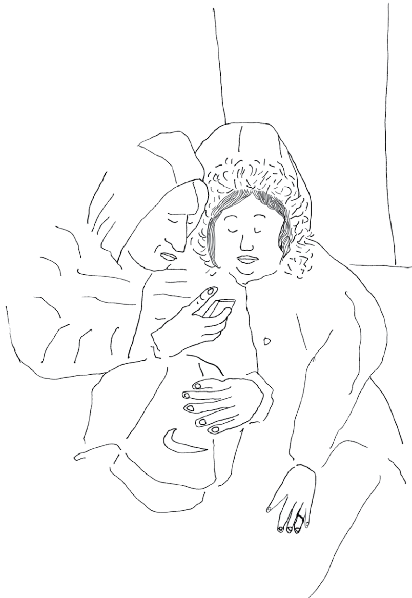
« La source de chaleur »