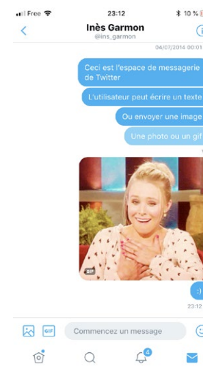
Fig. 1 La messagerie de Twitter

La mise en spectacle de la réponse, de son écriture et de son envoi (et même de son accusé de lecture), instancient et sémiotisent la présence de l'utilisateur dans la scène d'énonciation. L'avatar (ou Bitmoji , portrait personnalisable de l'utilisateur) incarne même, dans Snapchat, de façon iconique sa présence [Fig. 5]. En outre, le « petit geste » de tap associé à un clavier numérique (et à des lettres, des émoticônes, des dessins) est une forme familière pour l'utilisateur : elle