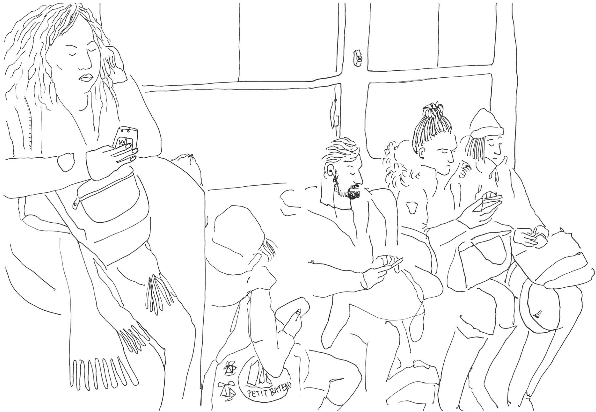
« La contagion cellulaire »