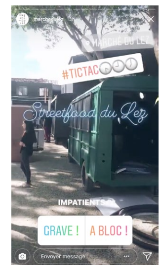
Fig. 3 Un sondage posté dans un contenu dans Instagram