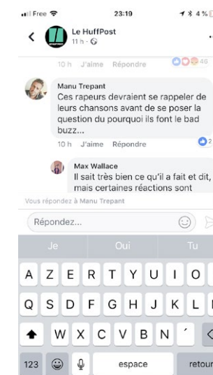
Fig. 2 L'espace de réponse à un commentaire dans Facebook