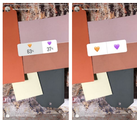
Fig. 6 Exemple de sondage lancé par une marque sur Instagram et questionnant la préférence de l'utilisateur

Pour conclure, alors que l'engagement corporel de l'utilisateur dans l'interaction favorise une adhésion aux discours qui y sont encapsulés et participe à l'incorporation de la norme technique, c'est à un engagement minimum comme auteur de réponse qu'incitent ces «petits gestes», et à une automatisation de son actualisation. Il en résulte une standardisation et une stéréotypisation des réponses, de ses formes et de ses modes, passant de forme fixée par les concepteurs – du fait du fonctionnement de l'écriture numérique – à forme sociale signifiante et circulante qui textualise les relations. Les «petits gestes» de réponse sont donc un lieu de pouvoir pour ces plateformes : il s'agit de gestes qui viennent équiper l'esprit, outiller les pratiques, médiatiser les relations et mettre l'utilisateur à contribution.