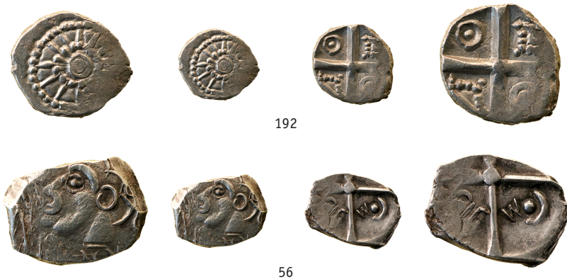
Figure 3 - Classes inédites découvertes dans le trésor de Montauriol (agrandissement \times 1,5 ).

Suite à cette notice préliminaire, le trésor de Montauriol fera l'objet d'une étude détaillée, actuellement en cours de préparation. Il convient ici de saluer la démarche des inventeurs qui, en déclarant officiellement leur découverte, vont rendre son étude possible.