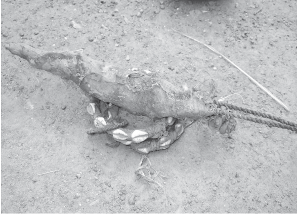
Ph. 1 : Un nazin déposé sur un lombo qui lui sert en même temps de support.