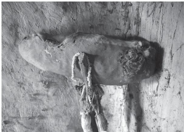
Ph. 4 : Nazin devenu massif par accumulation de matières sacrificielles et d'une succession de couvertures de peau de quadrupède (ici, de chien).

Un mot sur ces opérations consistant à immoler sur l'objet-fétiche un animal dont certaines parties du corps seront transférées à l'objet. Bien que s'apparentant, par de nombreux traits, à un sacrifice, elles relèvent d'un registre assez différent, plus proche de la simple offrande. Toute une dimension essentielle des authentiques sacrifices y est en effet estompée, voire évacuée : l'acte de trancher le fil d'une vie est ici moins fondamental que le prélèvement de matière pour nourrir le corps de l'objet. L'acte central de l'opération consiste à nourrir directement le corps même de l'objet en effectuant soi-même le transfert de matière depuis le corps de l'animal. On n'est pas dans le schéma d'une action qui reviendrait à nourrir métaphoriquement un dieu au cours d'un rite dont l'essentiel revient à sacrifier la vie de certains individus du troupeau ou de la basse-cour de l'intéressé. En forçant à peine le trait, on pourrait dire que l'action est plutôt d'ordre métonymique : l'ajout, renouvelé à chaque immolation, de matière animale contribue à la croissance et au renforcement de l'objet.