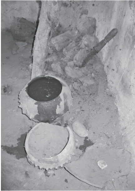
Ph. 5 : Autel de nanwamu avec son petit pot toujours rempli d'eau.