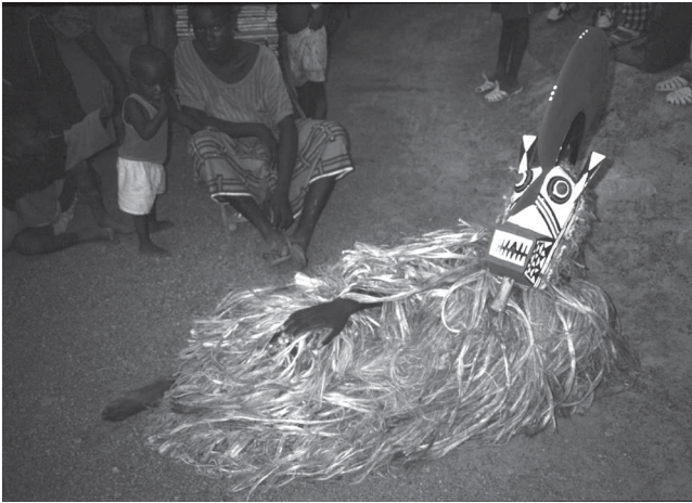
Ph. 8 : Masque hombo de grand format destiné à « sortir parmi les gens ».