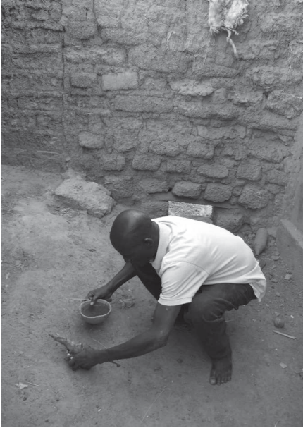
Ph. 2 : Même montage dans le contexte d'une opération rituelle.

De quoi les objets puissants en eux-mêmes sont-ils constitués, quelles formes présentent-ils ? En général composés de fragments végétaux et animaux 21 ,