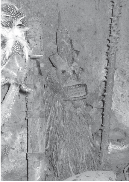
Ph. 7 : Nanwamu de masque hombo figurant le masque que portait le génie lors de la vision en brousse dont a été sujet le détenteur du culte.

danser. En revanche, le bois et les fibres sont tout à fait adaptés à une telle éventualité : quand la figurine est produite à l'aide de ces matériaux, c'est que celle-ci porte déjà en germe son devenir de figure dansée.