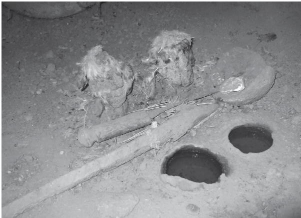
Ph. 6 : Autel de nanwamu dédoublé avec deux figurines grossières en argile et, au-devant, deux petit pots contenant en permanence de l'eau.