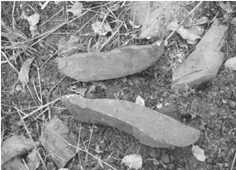
Ph. 4 : Lieu-dit Caaca : éclats de roche sur un site d'extraction des pierres destinées à servir de marteaux.

L'opération mobilisait une équipe réduite : en général, seuls s'y rendaient le maître forgeron et son apprenti le plus avancé (et le plus directement intéressé par l'opération), le « joueur » de marteaux 47 . À la différence, nous le verrons, du cas des enclumes, il ne s'agissait pas du transport d'un bloc de pierre déjà constitué, mais de l'extraction d'un fragment (ou de plusieurs, compte tenu de la gamme de marteaux nécessaires) détaché d'un ensemble plus vaste (voir photo 4).