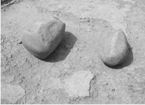
Ph. 3 : Un marteau de la catégorie dikpatikaal ( ditanjkpakpatikaal ou ntambeenjpatikaa ), pour « étirer » le fer (à gauche), à côté d'un marteau dit disajkaal ( ditanjkpasajkaal , encore appelé ntambeensajkaa ), pour régulariser la surface de la pièce de fer (à droite).

C'est sur ce critère de la forme de la partie percutante que s'appuie le système de dénomination en vigueur, selon un modèle conforme à celui que nous avons déjà rencontré au sujet des étapes préparatoires, avec une construction centrée sur le verbe correspondant à la fonction de ces outils, verbe auquel s'adjoignent, comme pour les autres percuteurs dont nous avons parlé, les composants ditanjkal (« pierre ») et -kaa , dérivatif de fonctionnalité (voir supra , p. 31).