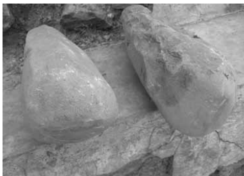
Ph. 2 : Marteaux de la catégorie dikpatikaal ( ditanƙpakpatikaal ou ntambeenƙpatikaal ) pour « étirer » le fer. Tout marteau de cette catégorie porte également le nom de dibɔɔkaal (« celui avec lequel on "joue" »), ou encore ditanƙpabɔɔkaal (dont la version dans la série des itambeen donne : ntambeembɔɔkaal ).