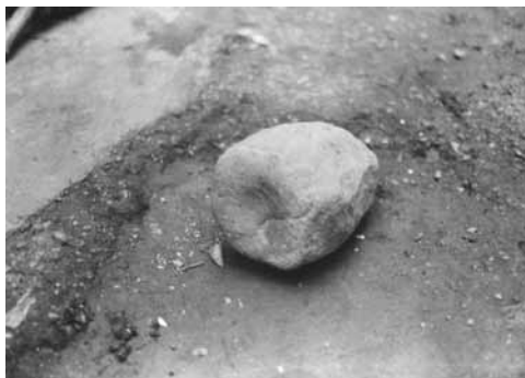
Ph. 1 : Marteau dipɔtikaal ( ditanƙpapɔtikaal ou ntambeempɔtikaal ) pour « désenvelopper » la boule ditanƙundi de sa capsule d'argile. Noter la forme concave caractéristique de ce marteau, le premier de la série de ceux dont font usage les forgerons.

Enfin, dernier trait notable de cette enclume par rapport aux précédentes, lui était associée non pas un percuteur unique mais toute une gamme de marteaux de pierre (Dugast 1986 : 42-45) 31 . Ceux-ci se différençaient les uns des autres par leur masse, par la nature de la roche dont ils étaient constitués, mais aussi et surtout par la forme de leur partie percutante, toujours en rapport avec une fonction déterminée : concave pour les premiers marteaux utilisés pour « désenvelopper » ( pɔti ) la boule ditanƙundi de la couche d'argile dont elle était enrobée (voir photo 1), cette forme était successivement, dans l'ordre des marteaux utilisés, plate et large, effilée (présentant une arête ; voir photos 2 et 3), plate et étroite (photo 3, exemplaire de droite) et enfin pointue.