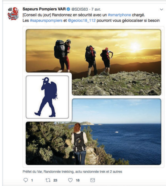
Figure 2. Exemple de communication dans le temps de la prévention (Compte Twitter @SDIS83 07/04/2018)

encouragent les randonneurs à vérifier l'état de la batterie de leur téléphone mobile avant de partir pour permettre leur géolocalisation en cas d'incident. Cette recommandation pouvant s'appliquer dans d'autres circonstances (risque d'avalanche, d'inondation, etc.) et elle poursuit un objectif principal : garder le contact avec des individus, qui se désengagent de plus en plus des autorités dans ce domaine.