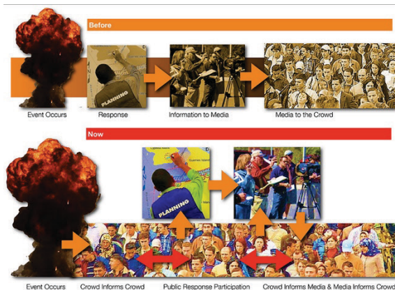
Figure 1. Changement induit par les MS sur le processus de communication

envoyés par des étudiants cafeutrés. Un Guide des bonnes pratiques des Médias Sociaux en Gestion d'Urgence (Rive et al., 2012) y a été rédigé par des organismes de défense civile en 2011, en indiquant les différents niveaux (juridiques, sociaux, technologiques, comportementaux) à prendre en compte. De telles initiatives ont ensuite été déclinées à l'échelle des pays. En France, un Guide d'utilisation de Facebook pour les préfetures a été édité par le ministère de l'Intérieur en 2014 par exemple. Plusieurs séminaires scientifiques ont aussi porté sur les MS et les risques à partir de 2014 (on peut par exemple citer la formation le 27 novembre 2014 organisée par l'Ecole Nationale Supérieure des Officiers Sapeurs-Pompiers, les formations aux médias sociaux en juin 2015 au Haut Comité Français de Défense Civile, ou le colloque SMARS organisé à l'Université d'Avignon en 2015) et tous s'accordent sur le potentiel offert par les MS.